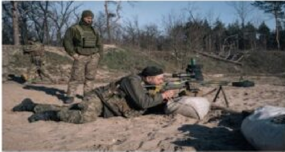
Soldiers seen at a firing range at an undisclosed location in eastern Ukraine on March 8.

By Ivanenko, Kharchenko, and Kozlov and Kozlov, Delaney March 28, 2022 at 5:55 p.m. EDT