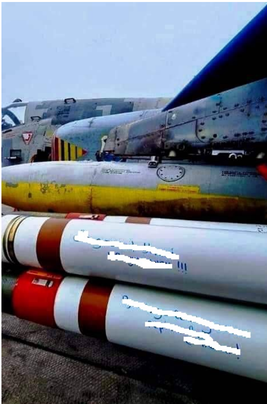
Rakety Zuni používané ukrajinským letectvem.

Fotografie raket Zuni převezených na Ukrajinu byly zveřejněny na ukrajinských sociálních sítích. Fotografie ukazují, že Zunis jsou používány útočnými letouny Su-25, zatímco závěsné odpalovací zařízení pro letouny byly speciálně upraveny. Některé ukrajinské útočné letouny zřejmě prošly speciální modernizací, aby mohly takové zbraně používat.