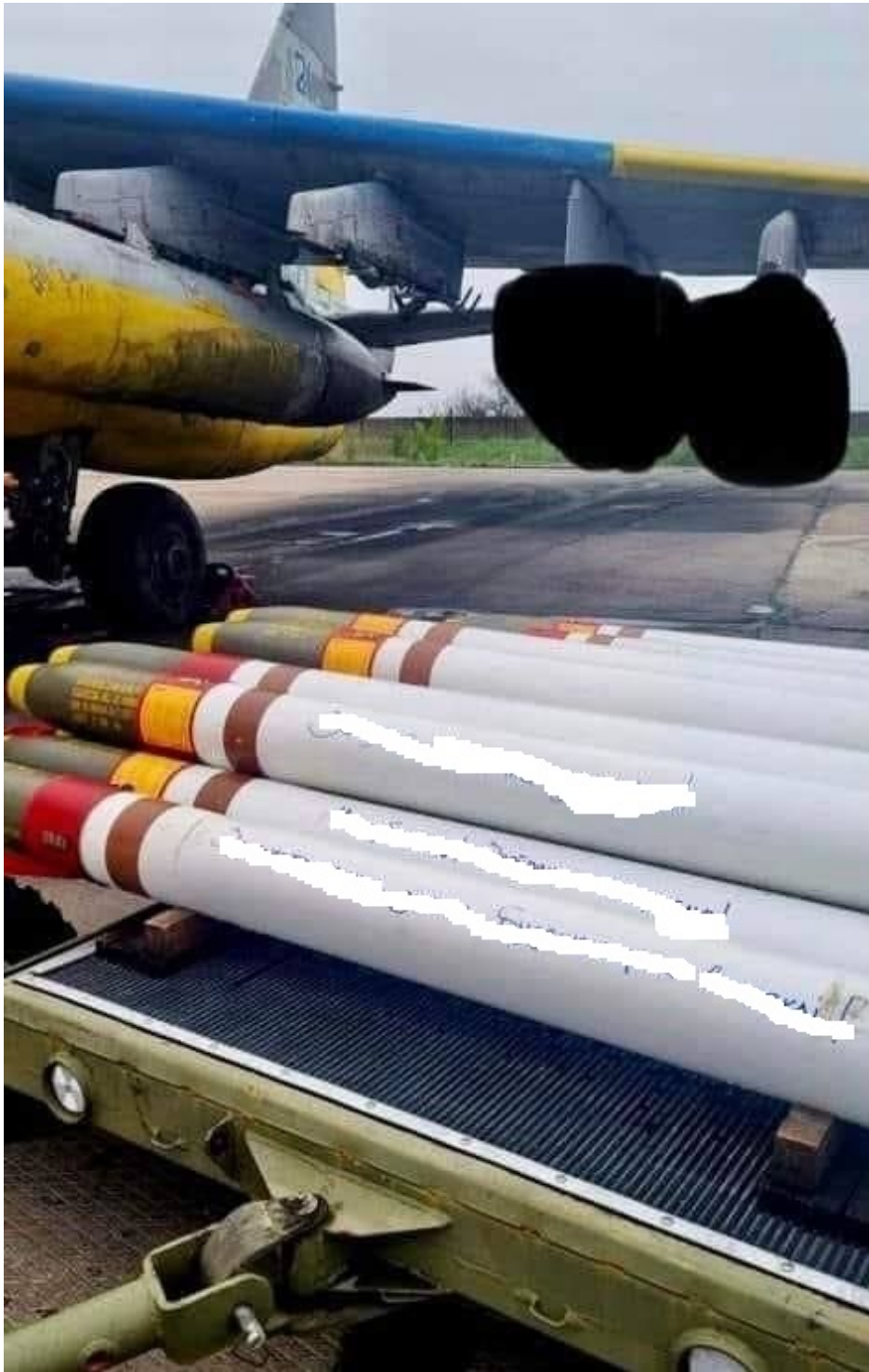
Rakety Zuni používané ukrajinským letectvem.

Zunis jsou v USA navržené 127mm neřízené rakety vzduch- země. Munice může být vybavena různými hlavicemi. Kumulativní fragmentační hlavice proniká pancířem o tloušťce 500 mm. Maximální dosah výstřelu je 8-9 kilometrů. Typicky se pro použití raket používá odpalovací zařízení LAU-10, které má čtyři trubková vedení pro umístění raket.