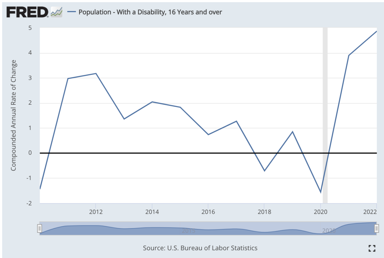
Snímek obrazovky – Zdroj: FRED

Čistě náhodně? Všechny takzvané corona late effects? Bez ohledu na čísla za rok 2020 by Karl Lauterbach nepochybně zvolil to druhé „vysvětlení“ – koneckonců, ti, kteří jsou zodpovědní za koronavirovou politiku, nemají zájem o skutečný výzkum příčin. Stále není jasné, kolik lidí bylo skutečně trvale poškozeno masovým očkováním experimentálními léky na genovou terapii. Jak dlouho budou politici moci popírat to, co udělali lidem tím, že zavedli povinné očkování?