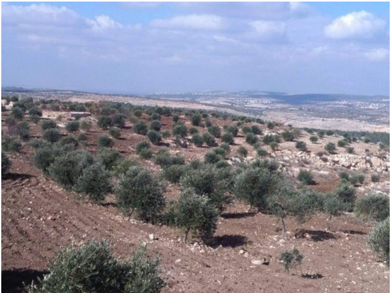
Olivové háje na Západním břehu

Největší obavou teď je, že jeho slepičí farma, která je dále v oblasti C Západního břehu, bude napadena izraelskými osadníky, zatímco on ji nebude schopen bránit. “Bojím se, že moje země bude ukradena.”