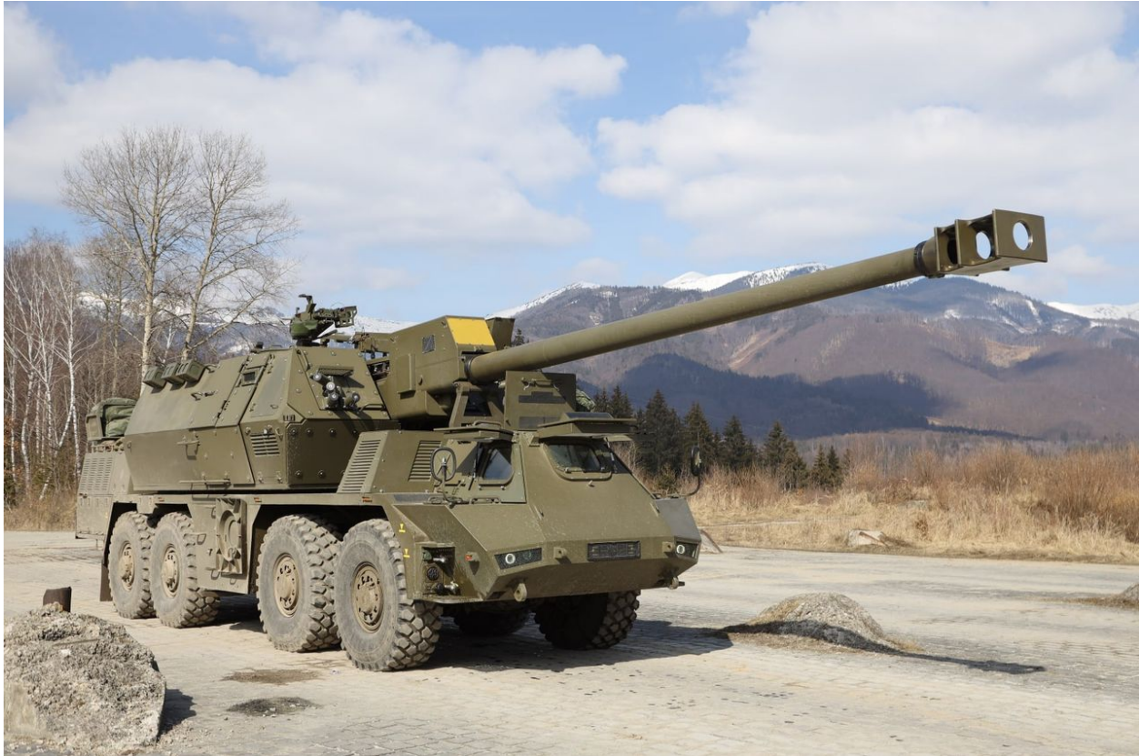
Slovenská samohybná houfnice Zuzana 2

Sorry, Roberte, ale tohle si musíš fakt ujasnit, tady už opravdu balancuješ na tenkém ledě s důvěrou voličů. Buď je prosazování míru na Ukrajině autentický postoj SMER-SD, anebo je to pouze mediální narativ a politická póza před voliči, zatímco zbraně ze Slovenska od soukromých firem budou vesele na Ukrajinu proudit dál, ty slovenské zbraně budou dál zabíjet Slovany na Ukrajině, před čímž Robert Fico sám před 2 týdny varoval [5], zatímco vláda bude mít alibi, že ze skladů slovenské armády už neodešla ani patrona. A k čemu to povede?