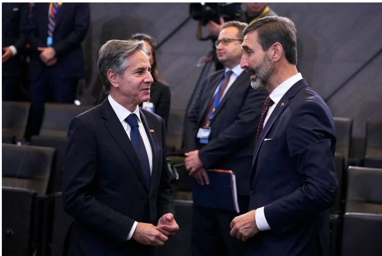
Ministři zahraničí USA a Slovenska, Antony Blinken a Juraj Blanár v Bruselu

O to více vás potom zarazí informace, která přišla z Bruselu. Ministr zahraničí Slovenska Juraj Blanár totiž na setkání s vrchním válečným štváčem, americkým ministrem zahraničí Antony Blinkenem, řekl [3], že Slovensko nebude Ukrajině posílat žádné zbraně, tedy zbraně z výzbroje slovenské armády, ale že vláda nebude slovenským zbrojním firmám a slovenským obchodníkům se zbrojní licenci bránit v dodávkách zbraní na Ukrajinu . Soukromé firmy ze Slovenska tak budou moci oddávat na Ukrajinu zbraně jako dosud. Tohle je hodně nebezpečná pozice pro Roberta Fica. Opravdu velmi riskantní balancování s důvěryhodností u voličů.