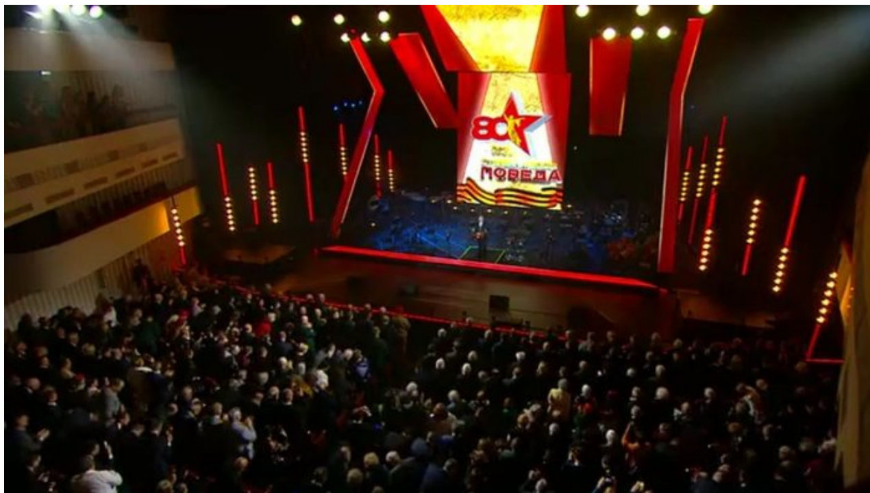
Projev probíhal v divadle ve Volgogradu

Bestie nechce přijít o vlastní kožich, a proto štěká a kibicuje ostatní, aby oni běželi vstříc pod hlavně děl nepřítel. Nikdo z těch politiků, až na vzácné a raritní výjimky v počtech, které spočítáte na prstech jedné ruky, maximálně dvou, nevolá po míru. Všichni volají do války a porážky Ruska, jako kdyby nešlo o největší zemi na světě s jednou z největších armád, jako kdyby nešlo o jadernou velmoc, jako kdyby šlo o nějakou banánovou republiku, do které je možné poslat “ mírové okupační mise ” NATO. Ruští pozorovatelé na ruské televizi, především v pořadu Vladimira Solovjeva, mluví už otevřeně o nevyhnutelnosti přímého konfliktu s NATO kvůli Ukrajině. Jde prý už jen o to, kdy k tomu dojde a kde nastane ten spouštěcí incident.