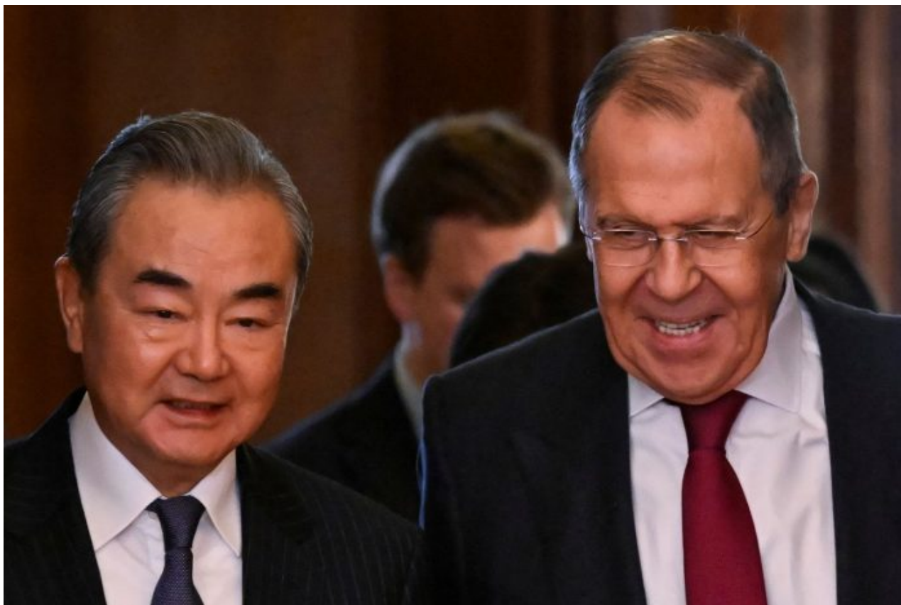
Ministři zahraničí Wang Yi a Sergej Lavrov

Proces na 1. prioritě však vychoval novou proti-českou generaci, která nenávidí český stát a české vlastenectví, která adoruje USA, Evropskou unii a Brusel, která nezná vlastní minulost a která trpí obrovskou rusofobií naočkovanou ze školství a z médií. Evropa je tak znovu proti-rusky naočkovaná a tudíž mají politici volnou ruku pro vyvolání války mezi NATO a Ruskem. Přesně kvůli tomu se to dělá, aby to nebyli politici, kteří štvou národ do války, ale aby to byl lid, který to žádá a politici lidu vyjdou vstříc.