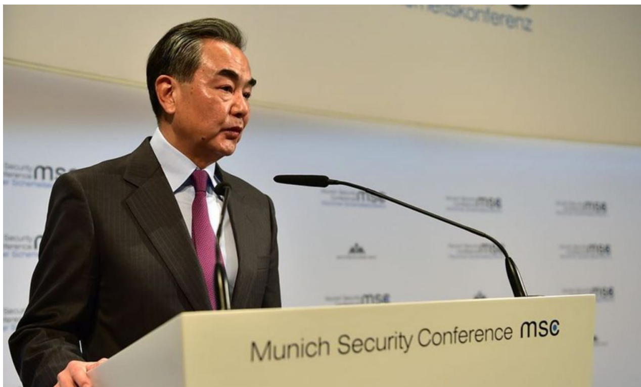
Čínský ministr zahraničí Wang Yi na bezpečnostní konferenci v Mnichově

Celá Evropská unie je projektem pohrobků nacistů III. Říše maskovaných do cvičebních úborů neoliberálů, kteří v politické rovině ale předevičují prostná cvičení hajlováním pravou rukou a podněcováním poválečného revanšismu a revizionismu v celé Evropě. Trvalo to nějakých 33 let, tedy celá Kristova léta po roce 1989, než byl bývalý Východní blok převychován a naočkován rusofobií a nenávisí ke všemu ruskému stejně, jako touto nenávisí Hitlerův režim očkoval Němce proti bolševikům a Židům.