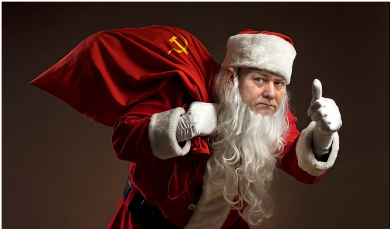
Komunista Vojtěch Filip, Fotokoláž: ATEO