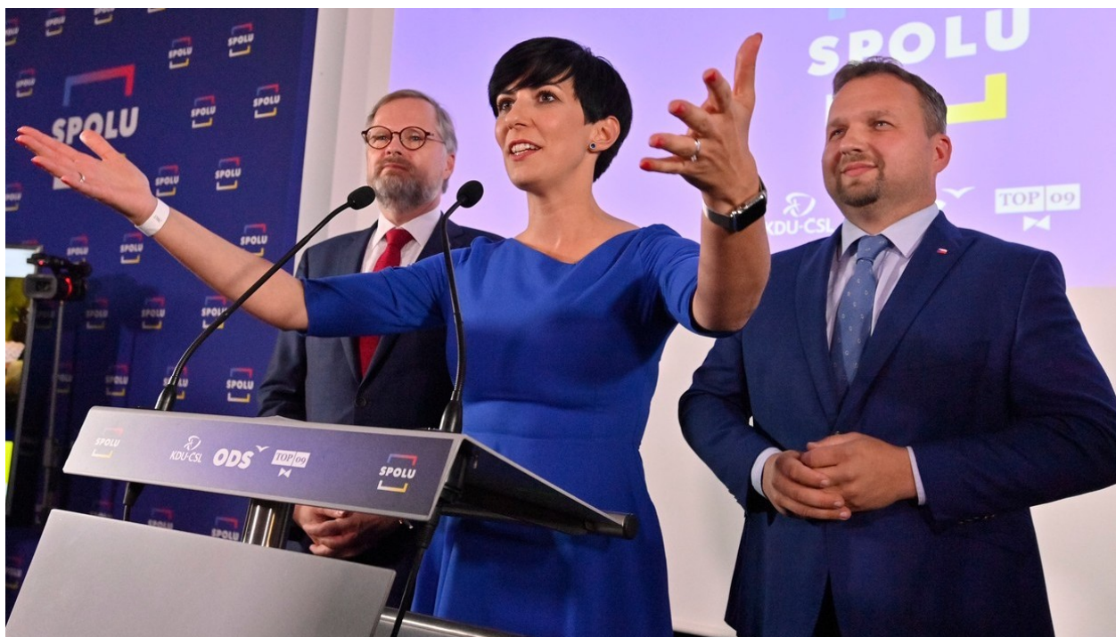
Petr Fiala, Markéta Pekarová Adamová, Marian Jurečka

Kverulant už podobných ujištění slyšel opravdu hodně. Jen málokdy došlo k jejich splnění, a proto se na jaře 2023 zeptal Poslanecké sněmovny, kolik ušetřila, kam si poslanci vyrazili tentokrát a kolik to stálo. Než mu sněmovna tyto informace poskytla, musel jí zaplatit 7309 korun.