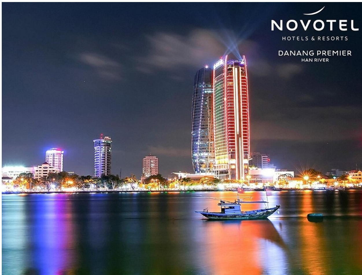
hotel NOVOTEL

Když jsme na konci letošního října poslali KPS svých deset otázek ohledně poslaneckých cest, zajímali jsme se i o typ ubytování. Dozvěděli jsme se toto: „Výběr (hotelu) provádí zaměstnankyně odboru mezinárodních vztahů KPS, a to na základě spolupráce s českými zastupitelskými úřady.“ Zdálo by se tedy, že poslanci na výběr svého ubytování nemají žádný vliv a „nezbude“ jim nic jiného než se smířit s tím, co jim zařídí jiní. V této souvislosti se nabízí citace z e-mailu, který nám přišel v souvislosti s nedávno zveřejněnou kauzou Vítkova cesta . Pisatel, skrytý pod iniciálami MK (přeje si zůstat v anonymitě, ale identitu známe), pracoval na jedné z našich ambasad a v této souvislosti píše: „Poslanci musí odjet z dané země plně spokojení, aby potom někde po parlamentních kuloárech nešířili zvěsti, že tam ten daný ambasador není člověk na svém místě, aby se to nedoslechli náhodou na Ministerstvu zahraničních věcí. Takže všechno musí být vyžehleno do detailů.“ Proto, jak dál uvádí MK, české ambasády za naše poslance i senátory