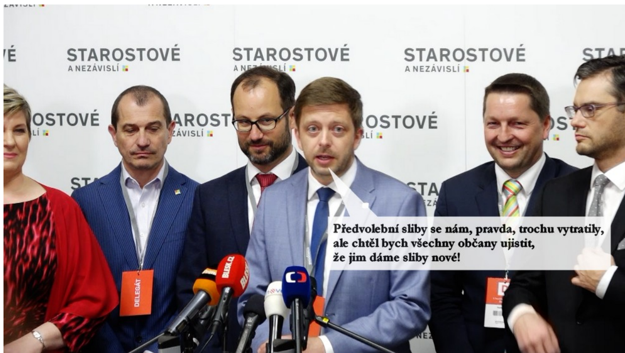
text: Václav Novák