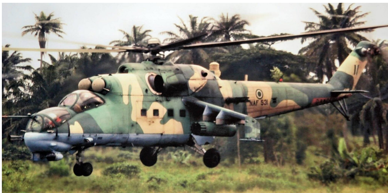
Vrtulník Mil-35M