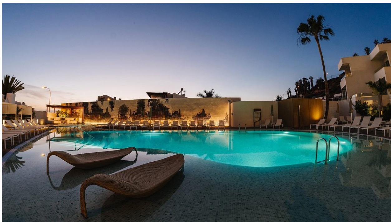
Ohasis Boutique Suites