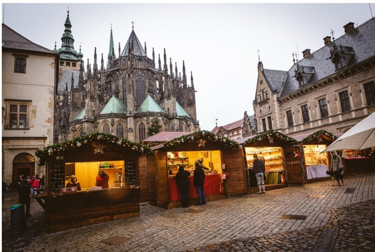
Vánoční trhy na Hradě

Jak už bylo uvedeno, Zeman vydal tři prohlášení, ve kterém opět tvrdí, že vždycky chtěl, aby Pražský hrad byl otevřen. Zeman samozřejmě lhal a Kverulant jej za to opakovaně kritizoval. Nebylo však jasné, co za tímto kompletním názorovým veletočem je. Ve čtvrtek 16. listopadu 2022 to konečně vyšlo najevo. Miloš Zeman po policii chtěl, aby zrušila kontroly u vstupů na Pražský hrad, protože blokují přístup ke stánkům a pódiu, které Hrad pronajal firmě, jejíž zaměstnanci poslali statisíce prezidentské straně.