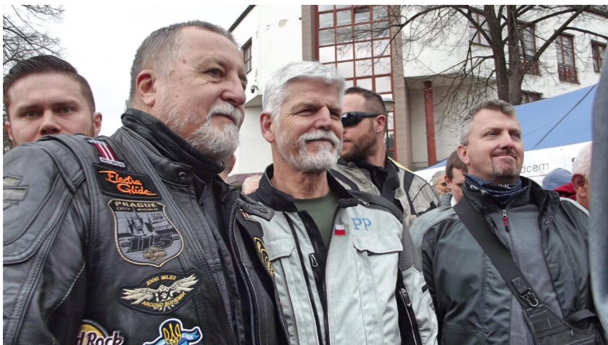
Petr Pavel na zahájení motorkářské sezony v Poděbradech 1. 4. 2023

Sobotu 1. dubna se v Poděbradech opět konalo zahájení motosezony. Akci pořádal Harley-Davidson Praha. Jízdy z Prahy do Poděbrad se účastnily na dvě tisícovky motorkářů. Do Poděbrad na zahájení dorazil i prezident Petr Pavel na svém stroji BMW.