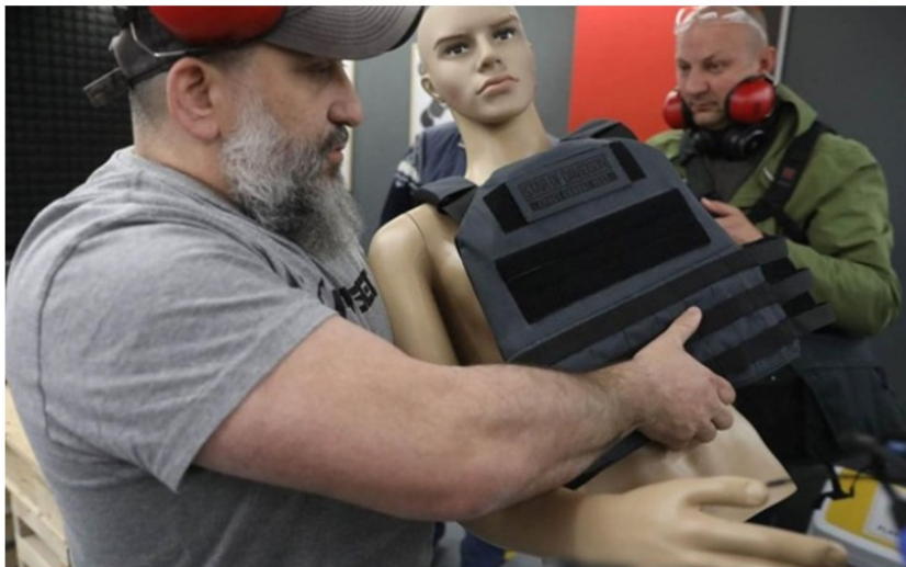
Z testu neprůstřelných vest

REPORTÁŽ Neprůstřelné vesty Star of Davidson jsou na profesionální úrovni a splňují i úroveň TBO-7CZ (třída balistické odolnosti). Certifikát verifikující tyto hodnoty vystavil Český úřad pro zkoušení zbraní a střeliva majiteli obchodní známky Star of Davidson.