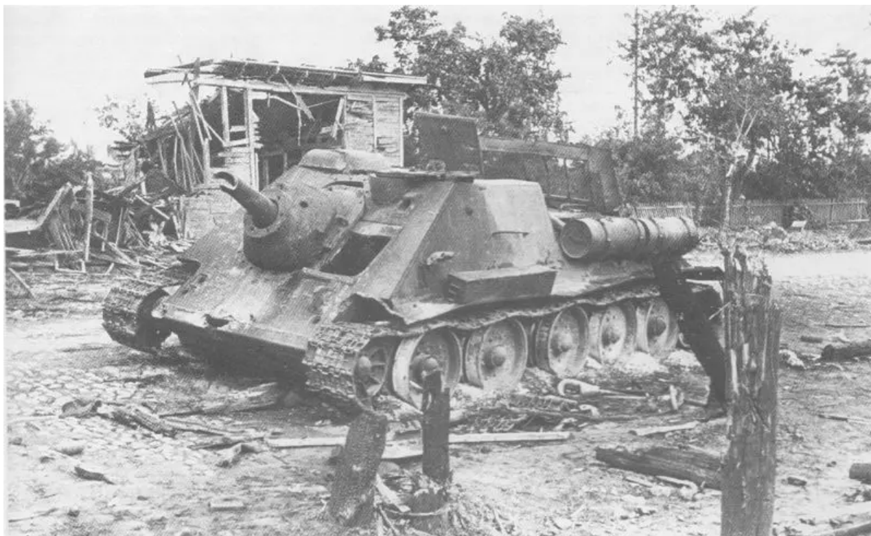
Sovětské samohybné dělo SU-85, zasažené a spálené v Mogilevu

postoupil Bakharovův 9. tankový sbor; z oblasti jižně od Parichi – 65. a 28. armáda Batova a Luchinského, Plievova jezdecko-mechanizovaná skupina (4. gardová jízda a 1. mechanizovaný sbor), 1. gardový tankový sbor Panov.