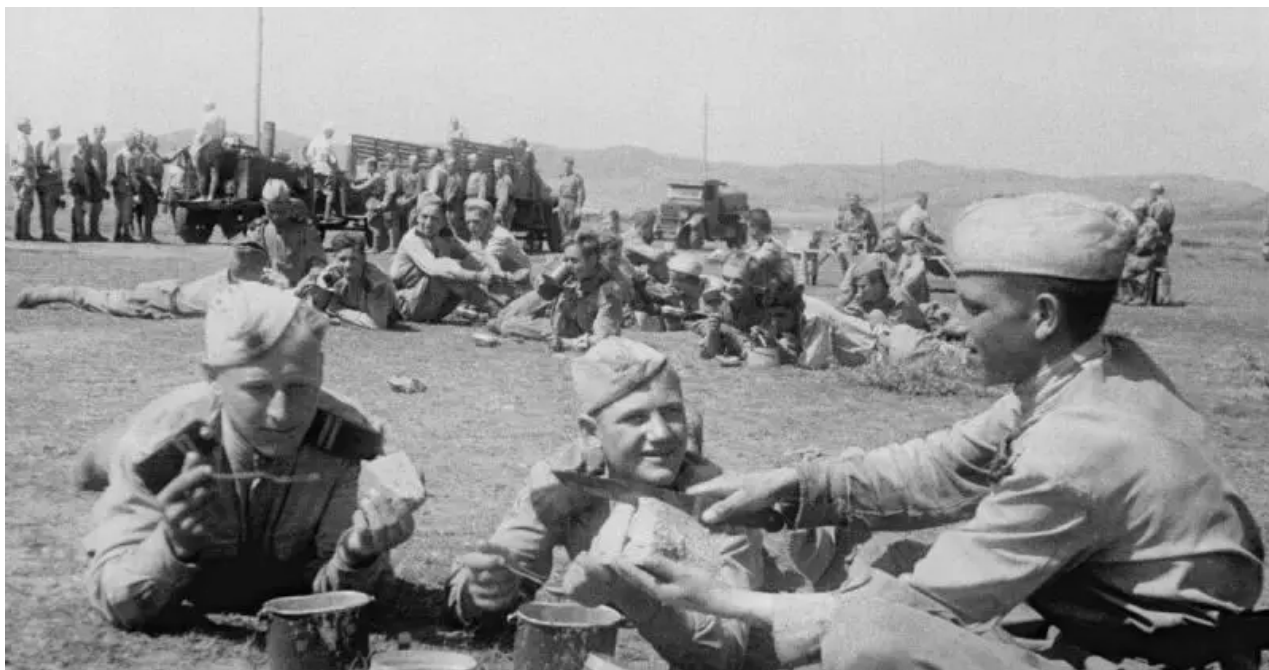
Vojáci 3. ukrajinského frontu obědvají v polní kuchyni v Moldavsku. 20. srpna 1944