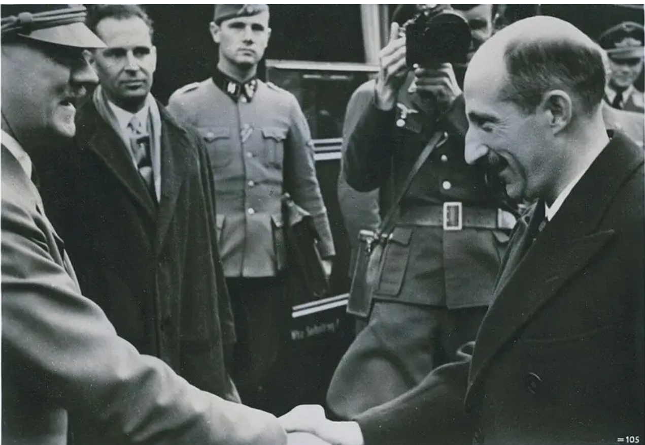
A. Hitler přijímá bulharského cara Borise III. dubna 1941

12. srpna 1944 Moskva znovu požadovala, aby Sofie přestala poskytovat pomoc Německu. 26. srpna, kdy byla porážka německých jednotek v operaci Iasi-Kišinev zřejmá, Bagryanov oznámil neutralitu Bulharska a požadoval stažení německých jednotek ze země. Bulharská vláda zároveň nepřijala žádná opatření k neutralizaci německých posádek v Bulharsku a nezasahovala do pohybu Wehrmachtu. Německé jednotky ustupující z Rumunska proto v klidu prošly přes bulharské území do Jugoslávie.