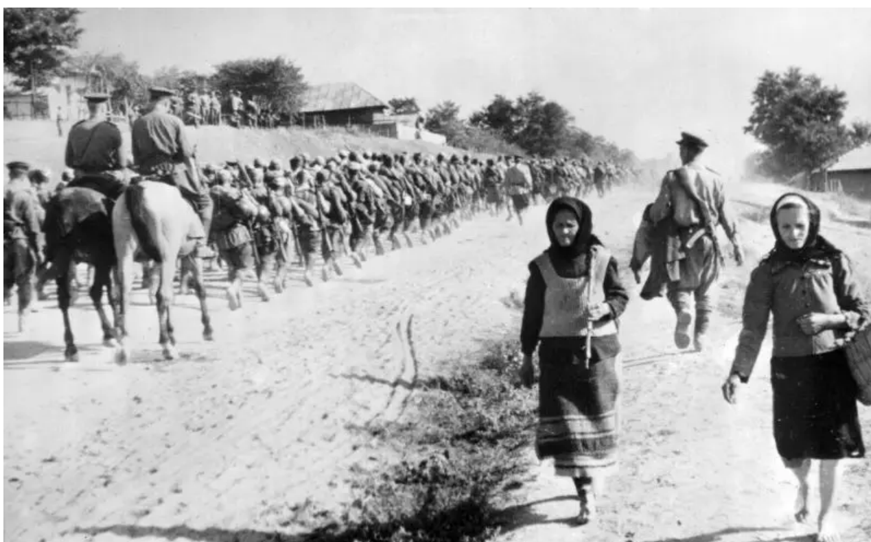
Jednotky 49. gardové střelecké divize na pochodu během operace Iasi-Kišinev. Moldavsko, konec srpna 1944.