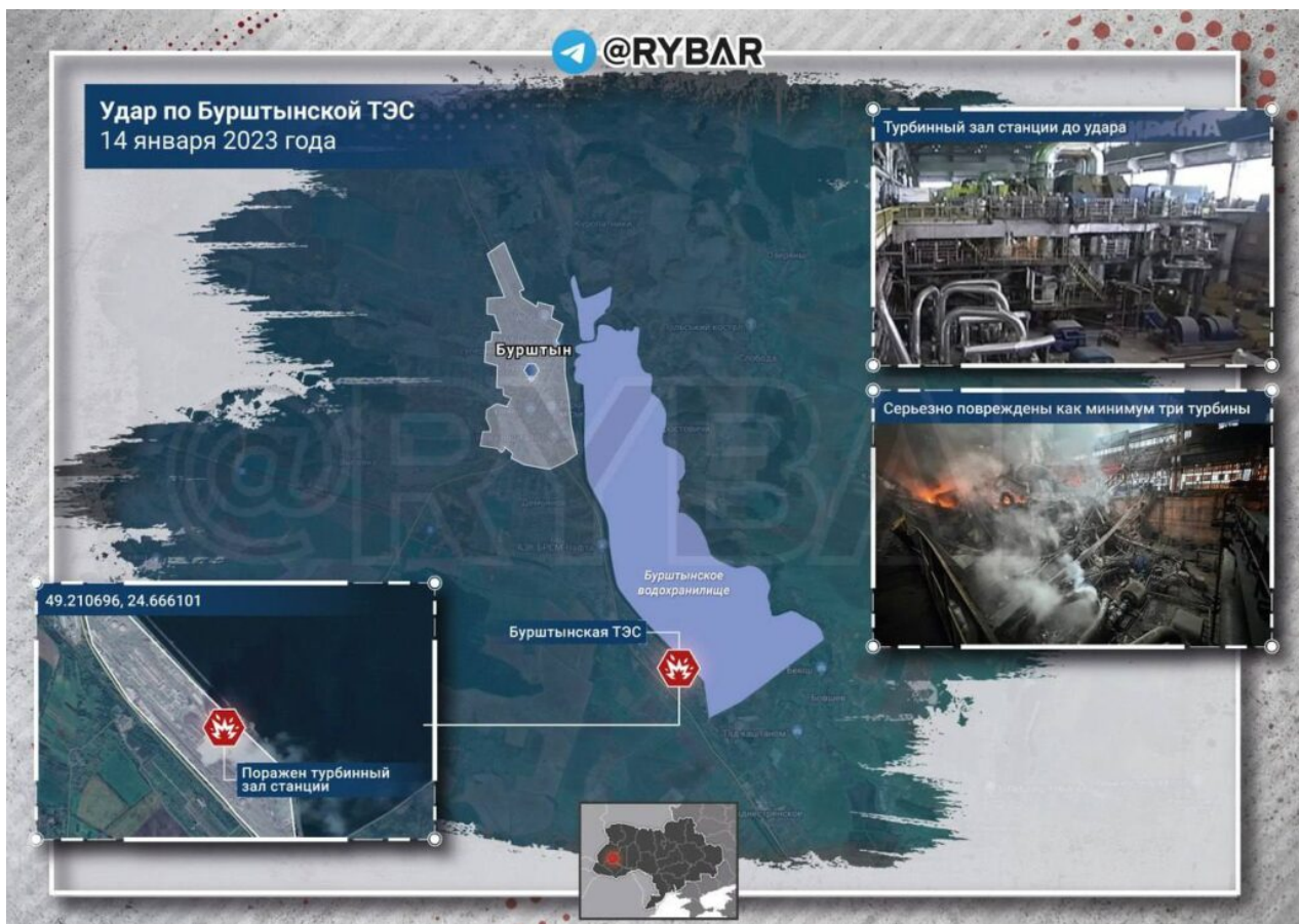
Foto: Burštýnská tepelná elektrárna po ruském raketovém útoku na turbíny . Mimochodem tato elektrárna dodávala elektřinu do EU v rámci tzv. Burštýnského elektrárenského ostrova. Cílem projektu bylo vyrábět elektřinu v době, kdy jí je v EU nedostatek.

Tuto analýzu jsem napsal díky zuřivému ryku pražské kavárny na Babiše, kvůli jeho nejnovějším plakátům, jak jsem psal v úvodu. Osobně jsou mi nesympatičtí oba. Chci ovšem mír, aby moje děti a vnoučata měli jistotu, že nepadnou v nějaké nesmyslné válce, a nebo jim Iskander nepřistane na hlavě. Tak se mějte a držte míru palce!