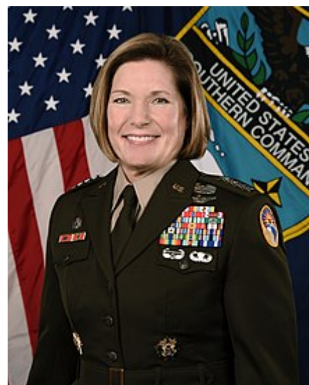
Foto: US-Generálka Richardsonová zklamala na své misi v Jižní Americe na celé čáře. Když požadovala zbraně pro Ukrajinu, dostala odpověď: Nedali bychom Vám ruské zbraně, i kdyby to byl šrot! A pak bylo ještě hůř!

Putin měl včera radost i ze zemí Jižní Ameriky. Tam se před týdnem vypravila na turné US generálka Laura