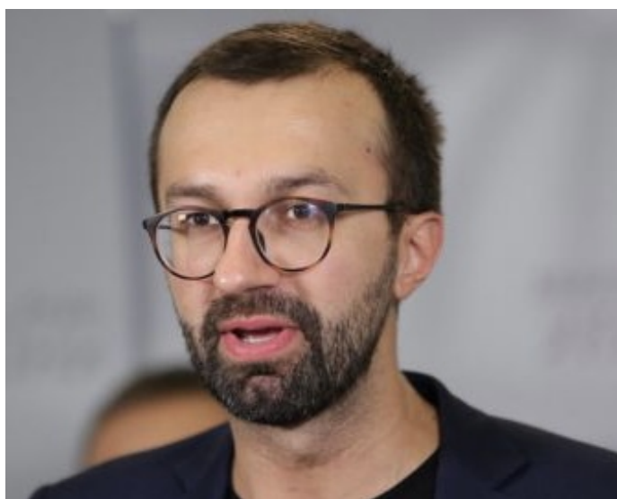
Sergej Leščenko z kanceláře prezidenta Ukrajiny včera 28.11. v televizi přiznal obrovské 98% ztráty Armády Ukrajiny na živé síle!

Včera večer, Sergej Leščenko, poradce ředitele kanceláře prezidenta Zelenského šokoval ukrajinskou veřejnost , když v televizním vystoupení poprvé oficiálně přiznal obrovské ztráty, které Ukrajinská armáda v posledních měsících utrpěla. Podle Leščenka frontové rotý vojsk Soldatesky, které z posledních sil odrážejí stále silnější ruské útoky, už často tvoří jen poslední 3 vojáci, místo obvyklých 110 vojáků, se