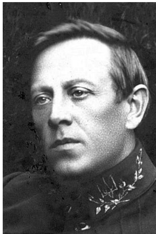
Organizátor 1150 Pogromů na Židy, při kterých bylo ukrajinskými jednotkami

V Žitomiru, jako i v Kyjevě a dalších městech je jedna z hlavních ulic pojmenovaná po tzv. hrdinovi Ukrajiny Simonu Petljurovi, který byl 1. ministrem obrany samostatné Ukrajiny v letech 1918/19, a potom prodal Polsku Halič a Volyň výměnou za válečnou podporu svého tažení proti Ruským bolševikům. Během tohoto tažení Petljurovy bandy a polská vojska dobyla několik měst, včetně Žitomiru. To co následovalo otráslu všemi tehdejšími intelektuály na Západě. Petljurovy bandy rozpoutaly na dobyté západní Ukrajině první organizovaný holokaust v dějinách lidstva, při kterém bylo brutálně vyvražděno při 1100, (1295)