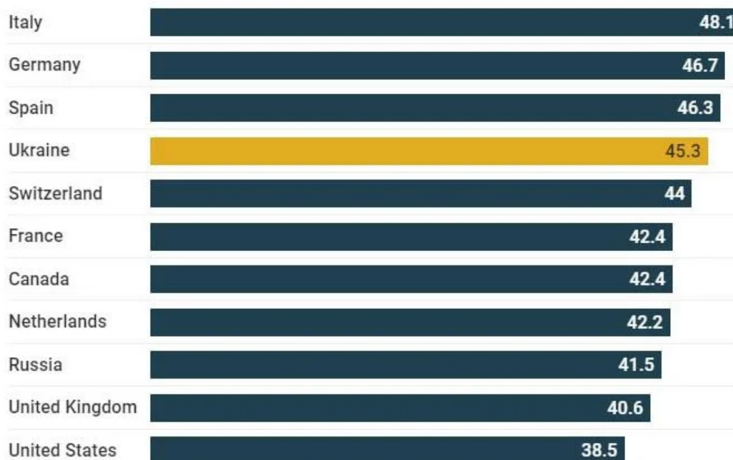
Chart: The Times and The Sunday Times

Věk průměrného vojáka Ukrajiny je nižší, než věk průměrného vojáka NATO – zdroj CIA!