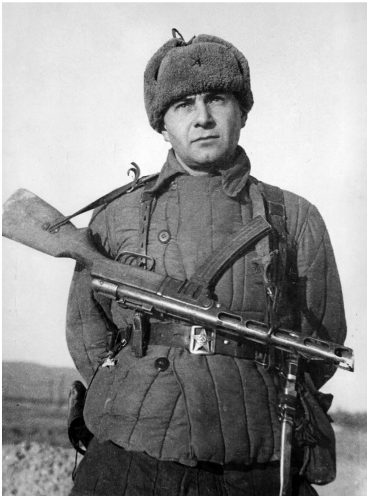
Major Caesar Kunikov, krátce před svou hrdinskou smrtí v boji proti nacistům a banderovcům!

Podle technického rozboru videa z útoku ukrajinských dronů na loď Cesear Kunikov je zřejmé, že do útoku byl přímo zapojen strategický dron USA RQ-4B. Ukrajinské námořní drony dokáží loď velikosti Kunikov zpozorovat pouze na vzdálenost 4km, protože jejich kameru lze vysunout jen velmi nízko nad hladinu moře. Drony jsou navíc velmi pomalé – 10 uzlů maximálně, a proto musí být do oblasti cíle naváděny satelitem, a při útoku řízeny leteckým dronem. Ukrajina nedisponuje žádným satelitem s technickými parametry, aby mohl sledovat ruské lodě v Černém moři, a navádět v reálném čase námořní