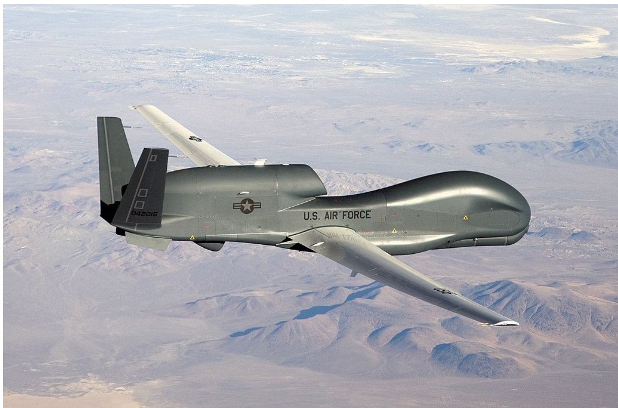
US Dron RQ-4B, který řídil ukrajinské námořní útoky na ruské lodě severně od Bosporu – 9.2, a jižně od Krymu 14.2.

Lod' Caesar Kunikov vyplula včera ze Sevastopolu okolo krymského pobřeží a z nejasných příčin se u nejjihnější výspy poloostrova zastavila a driftovala na místě. Zda to byl úmysl, či následek poruchy, je nejasné. Kunikov byla loď třídy Ropucha, která je na konci své technické životnosti. Byla postavena v roce 1986, a nemá takřka žádné moderní radioelektronické ani raketové vybavení. Rusové tyto lodě v poslední době používali pouze jako pomocná zásobovací plavidla. Driftování Kunikova pokud nebylo způsobeno poruchou mělo za cíl spustit ukrajinsko-americký útok a zaznamenat přenosy dat mezi RQ-4B USA a útočícími drony Ukrajiny. Podle tohoto videa z útočného dronu – na palubě lodi bylo několik málo desítek osob, svítilo se, a loď se k odražení útoku nijak nepřipravovala, a nepohybovala se.