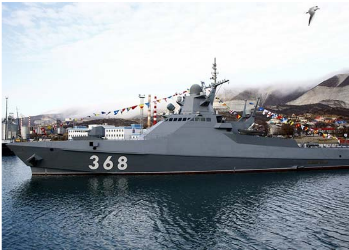
Hlídkový člun typu 22160 úspěšně odrazil útok americko-ukrajinské formace severně od Bosporu 9. února 2024, když doprovázel ruské tankery na plavbě do Novorossijska

překřížit mu cestu, protože to je vzhledem k jejich malé rychlosti jediný způsob jak na konvoj zaútočit. Podle ruských údajů americký RQ-4B po ukončení ukrajinského útoku ruský námořní konvoj přestal sledovat a odletěl. Časová souvislost výskytu amerických dronů nad napadanými ruskými loděmi i technické možnosti Ukrajiny je v Černém moři vypátrat a provádět na ně útoky, hovoří jasně – USA přímo řídily útok ukrajinských dronů na ruské lodě!