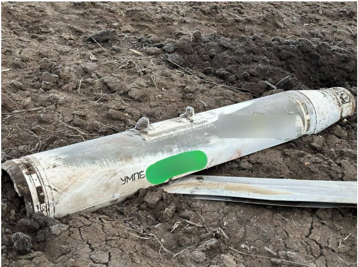
Ukrajinci podrobili zachovalé úlomky bomb GLSDB – УМГБ Д-30СН zkoumání, a z nich vyvodili: