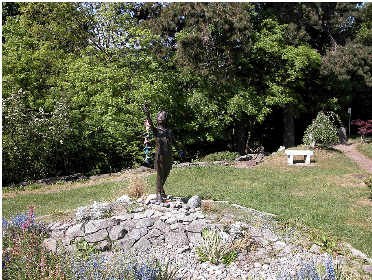
Socha Sadako Sasaki v Peace Park v Seatlu.

Koncentrační tábor Salaspils byl za druhé světové války místem těch nejodpornějšího zločinů , jaké si lze představit. Tábor společně provozovali němečtí a lotyšští nacisté . Vůdce lotyšských komand Viktors Arājs proslul zvláště ohavným týráním židovských žen a jejich znásilňováním před vyhlazením. Po válce utekl do Anglie, kde získal novou identitu. Lotyšští nacisté se za války proslavili stejně ohavnými zločiny jako jejich souvěrci – ukrajinští banderovci OUN-M, ( podrobně v MAP 1879 ), a samostatně vyhladili polovinu lotyšských Židů. Po válce se v lese u tábora Salaspils našel skrytý hromadný hrob 7000 dětí. Forezním zkoumáním zbytků jejich těl se zjistilo, že buď zemřely absolutním vyčerpáním, a nebo byly otráveny arsenem. Dále se zjistilo, že dětem byla před smrtí odebírána krev. Dalším vyšetřováním a výslechy svědků bylo zjištěno, že tzv. lotyšská Arāja komanda a nacisté zřídili v Salaspils zvláštní dětský tábor , do kterého sváželi zejména běloruské a ruské děti, a odebírali jim krev dokud nezemřely na selhání organismu nebo vyčerpáním. Děti, které při procesu odebírání krve onemocněly, a jejich krev už nebylo