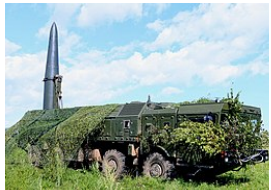
Ruský 9k-720 Iskander-M

Video zachycující zničení M270 MARS, (německá verze US M270 MLRS ATACAMS), krásně ukazuje “tupost” ukrajinské generality, veškerou marnost západní pomoci kyjevskému režimu, i důvody, proč “měkkého” Šojgu nahradil “asketa” Bělousov: