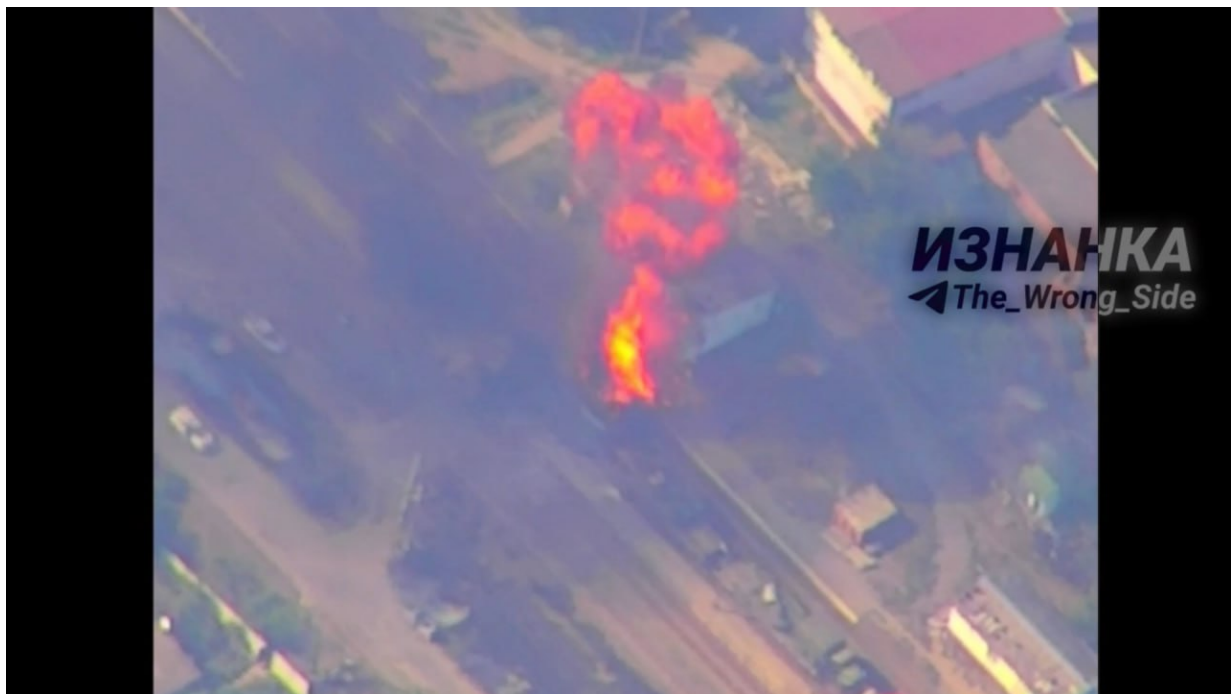
Foto ze včerejšího výbuchu ukrajinského vlaku na nádraží Budy po úderu prvního Iskanderu. (Další fotky z ruského útoku na nádraží Budy, zde. ) (Kontrolní satelitní mapa Google potvrzuje, že byl opravdu zasažen vlak v nádraží Budy. Mapa se Vám otevře zde. )

Včera dopoledne si ruský dron 55 km od frontové linie vyčíhal velký ukrajinský vlak dopravující na frontu západní techniku, zásoby i posily. Vlak sledoval až do železniční stanice Budy u Charkova. A když v ní vlak zastavil, a Ukrajinci ho začali vykládat, ruský dron přesně do středu vlaku zacílil první ruský Iskander. Obrovský výbuch jeho hlavice způsobil nejen požár, ale i ještě větší sekundární výbuch několika dalších vagónů, možná naložených dělostřeleckou municí generála Pavla, která se právě začala dodávat ukrajinským frontovým jednotkám. (Velmi krásné video snímané z ruského průzkumného dronu ze včerejšího prvního útoku balistické rakety Iskander na vlak ve stanici Budy, najdete zde. )