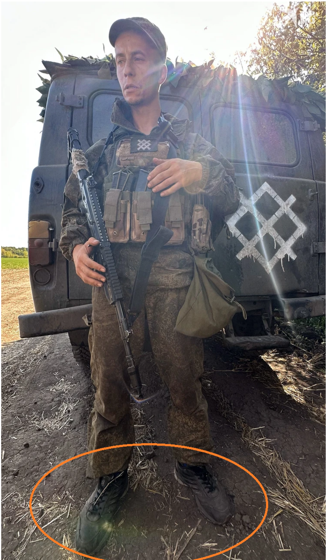
Příslušník 9. pluku 18. divize 11. armády operační skupiny Sever generála Lapina s volacím znakem Fox vyfotografováný 27. srpna těsně po průlomu ze 14 dní trvajících obklíčení v ženské věznici