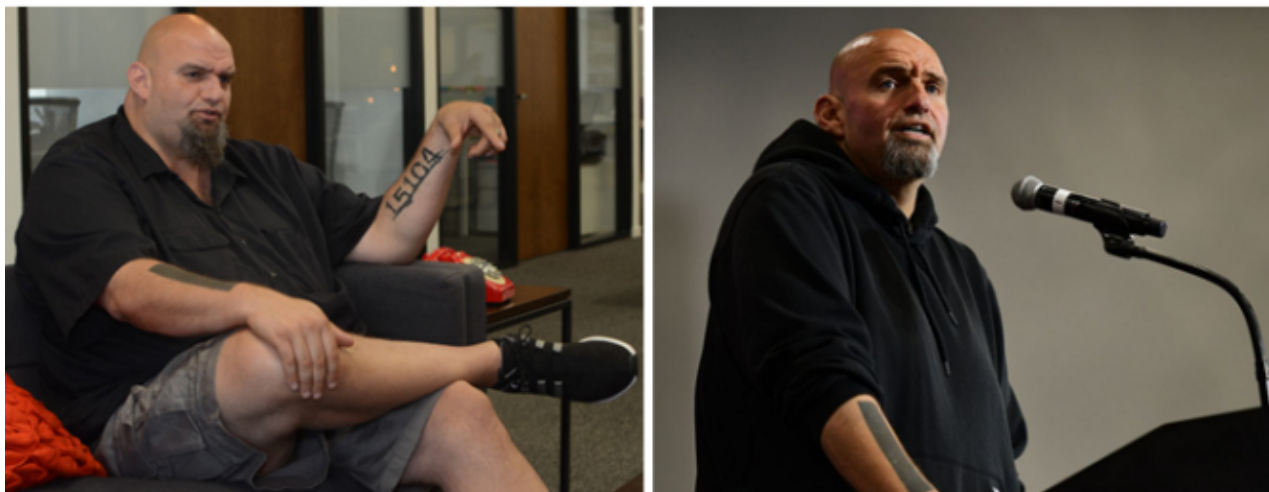
John Fetterman vyhrál „volby“ s 51 % a stal se senátorem

V diskusi se svým oponentem potřeboval pomoc speciálního softwaru, který mu na obrazovce vysvětlil, o čem diskuse je. Pokud jste debatu sledovali živě, pak chápete jak absurdní bylo poslat tohoto muže do Senátu zastupovat lid. Ale přesně to se stalo. John Fetterman, který jen s obtížemi dokáže myslet a mluvit, získal 51 % hlasů. Muže řídí jeho žena, bisexuální Brazilka s vazbami na tajnou službu.