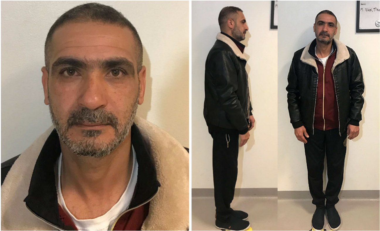
Nael Tibo.