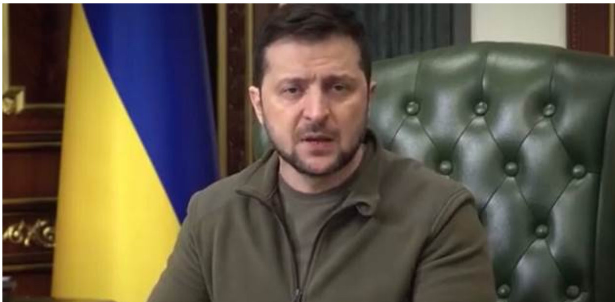
Popisek: Ukrajinský prezident Volodymyr Zelenskyj

Ukrajinský prezident se tentokrát hodně zlobí. Na Kanadu. Tato země podle ukrajinského prezidenta udělala velikou chybu, za kterou podle nejvýše postaveného politika na Ukrajině zaplatí celý demokratický svět.