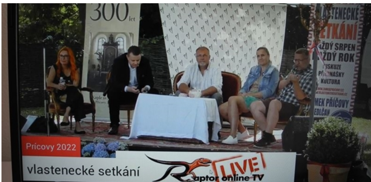
Foto ze záznamu vysílání z Vlasteneckého setkání.

Rajchl předpokládá naprosto zásadní střet. „I když byl socialismus, vždycky mohli přijít lidé, kteří vám dali hotovost a mohli vám solidárně pomoci. V novém systému to nebude možné. Nikdo vás nebude mít možnost zachránit. Tohle musíme jednoznačně odmítnout,“ konstatoval Rajchl. „Zachraňme si hotovost. Navrhujeme, aby bylo do Ústavy ČR zakotveno právo platit v hotovosti,“ řekl. To vše souvisí i se zachováním práva na analogový život. „Když máte právo vést analogový život, měli bychom mít i právo platit v hotovosti,“ dodal.