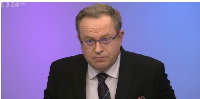
Popisek: Václav Moravec

Středoevropská observatoř digitálních médií. Výzkumné centrum vystupující spíše pod anglickou zkratkou CEDMO si už dva roky klade za cíl „zkoumat a prioritizovat hlavní zdroje a příčiny nežádoucích informačních jevů ve střední Evropě“.