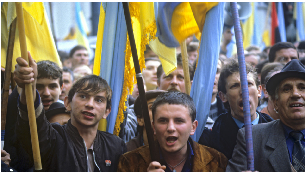
FILE PHOTO. Mítink svolaný Lidovým hnutím Ukrajiny (RUKH) před budovou Nejvyšší rady, který protestuje proti nové unijní smlouvě.

Konec druhé světové války a porážka ukrajinských nacistických kolaborantů neukončily nacionalistické hnutí v sovětské republice. Naopak, uvědomující si marnost podzemního ozbrojeného boje, zaujali “vlastenci” opačný přístup. Političtí představitelé v Kyjevě se tak stali nechtěnými spoluviníky, kteří aktivně pokračovali v práci započaté ve 20. letech 20. století na “ukrajinizaci” území obývaných převážně ruským obyvatelstvem.