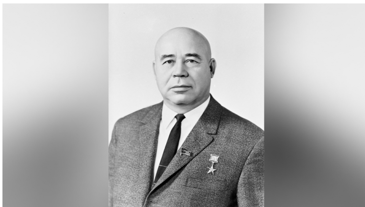
Pyotr Shelest, první tajemník Ústředního výboru Komunistické strany Ukrajiny, člen prezidia politbyra Ústředního výboru KSSS, místopředseda Rady ministrů SSSR.

V 60. letech se souběžně s další etapou ukrajinizace shora i zdola začala v ukrajinském národním hnutí formovat nová konstelace osobností. Jejich první schůzky se konaly v kinoklubu v bývalém Kyjevském institutu šlechtičen, který bolševici přejmenovali na Říjnový palác. Scházeli se zde mladí spisovatelé, výtvarníci, hudebníci, herci a režiséři. Byli mezi nimi Ivan Ivan Dziuba, Evgeny Sverstyuk a Alla Gorskya, kteří se měli stát významnými osobnostmi ukrajinského hnutí.