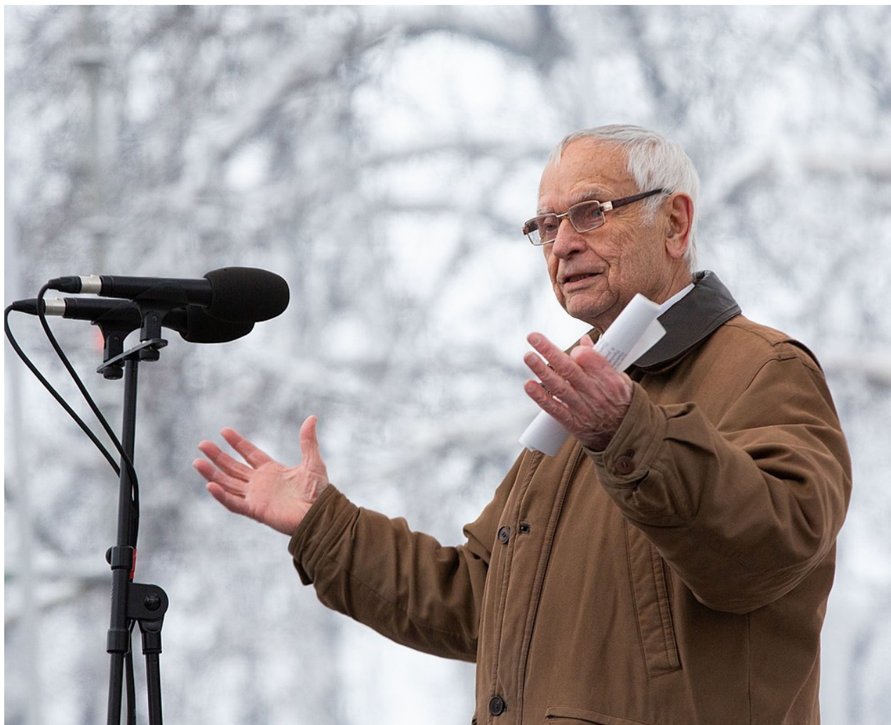
Dmytriy Pavlychko.