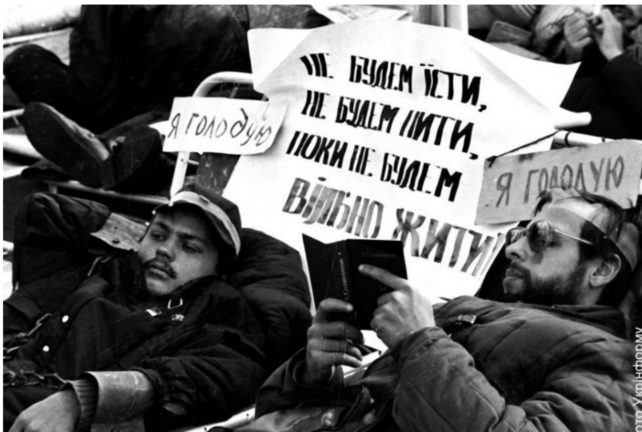
Participants of hunger strike during 'Revolution on Granite', Kiev, 1990