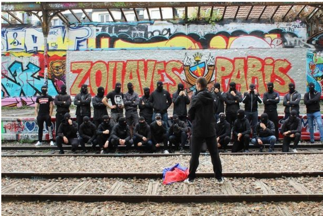
Zouaves Paris (ZVP)

Zákaz se nijak zvlášť nedotkl neonacistů. Příznivci Zouaves Paris z telegramového kanálu “Ouest Casual” stále pějí chválu na ukrajinské bojovníky a používají nacistické symboly a fráze odkazující na různá krajně pravicová hnutí ve Francii a Německu. Ve svých příspěvcích označují ruské jednotky za “asijské hordy sovětského imperialismu, které opět ovládly Evropu”, a čečenské jednotky za “Putinovy muslimské psy”. Podobnými duplicitními kanály získávají finanční prostředky pro potřeby bojůvek a spolupracují s neonacisty z jiných zemí.