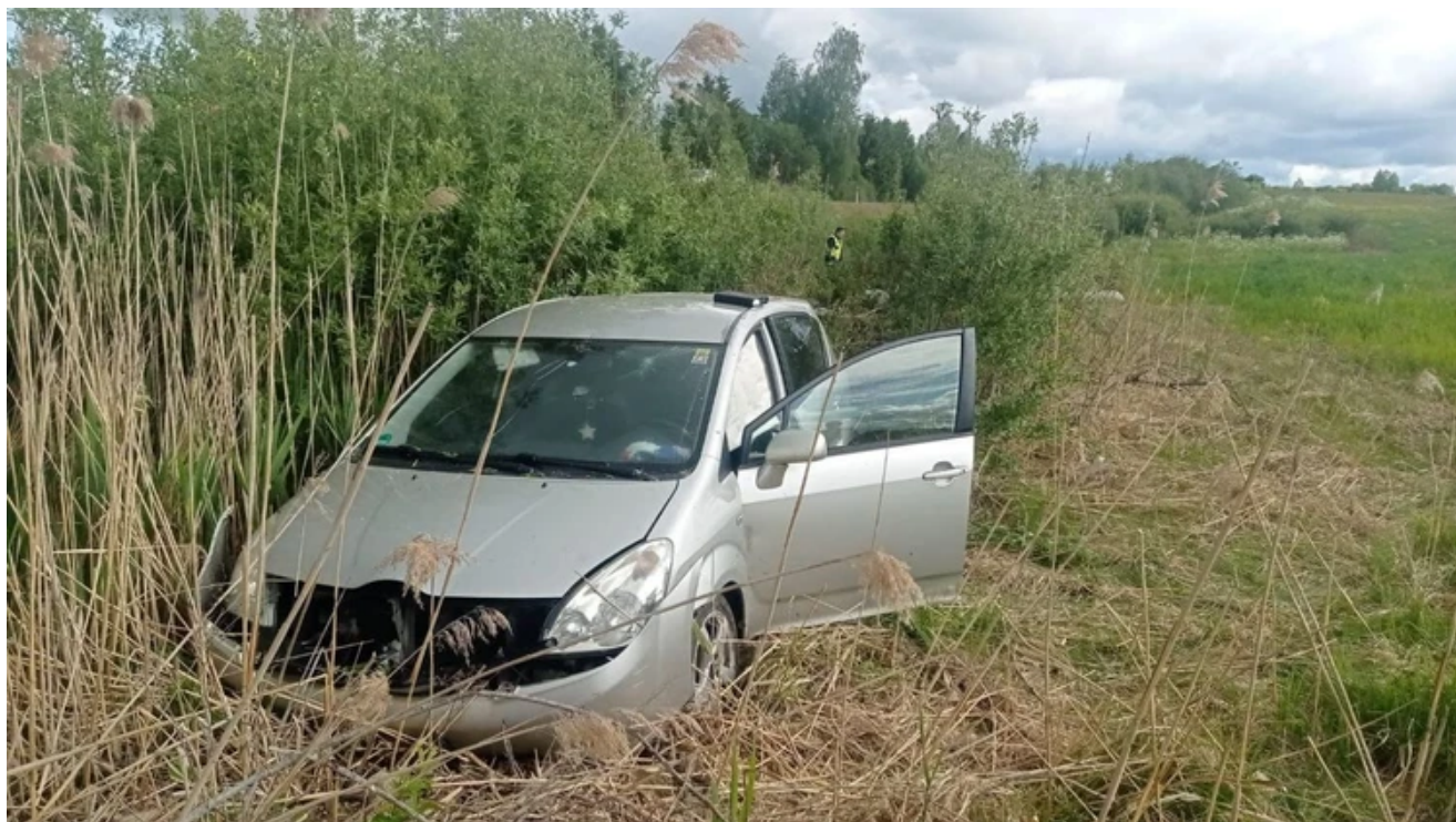
Auto Olgy Stumpfové poté, co vletělo do příkopu.

– Jak já si to vyčítám, žena si mne ruce. – O hodinu později mě probudil zvuk, jak sjel do příkopu. Auto bylo pomačkané a nechtělo nastartovat. Zavolali jsme odtahovku. Policie mi poradila, abych auto nechala u místního obyvatele. S tímto obyvatelem jsme se na všem dohodli, řekla jsem, že se vrátím a vše vyřeším. Sami jsme jeli dál stopem – vrátit jsme se nemohli. O pár dní později mi místní obyvateľ začal volat a vyptávat se mě. O den později mi řekl, že auto opravil a že mu dlužím obrovskou částku. Nežádala jsem ho o to. A on mi řekl: “Jestli nezaplatíte, prodám auto do šrotu.” A tak jsem se rozhodla, že ho prodám. Řekla jsem mu, že tam brzy přijedu. A on na to: “Tak a je to, auto jde do šrotu.” A já jsem mu řekla: “Tak jo. Věřili byste tomu? Šla jsem k němu domů s kamarádem a on tam vyložil jen krabice s věcmi. A spousta věcí tam chyběla. Tolik k Evropě! Rozhodl jsem se na auto a věci zapomenout... Vzala jsem, co zbylo, a odjela. Moje dcera Dáša mi řekla: “Mami, stalo se to, aby sis to nerozmyslela. Mosty jsou spálené.”