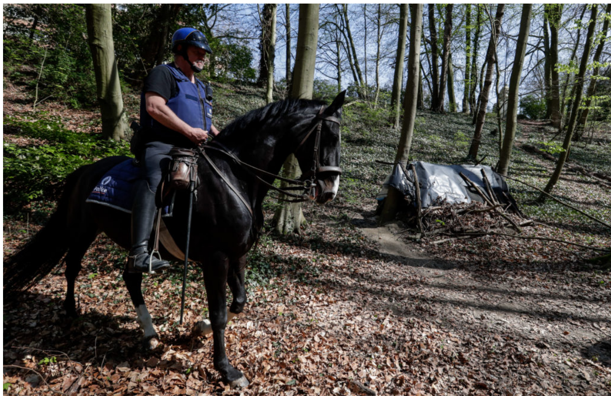
Jízdní policie zastaví před stanem bezdomovce, aby zabránila lidem zdržovat se na stejném místě příliš dlouho