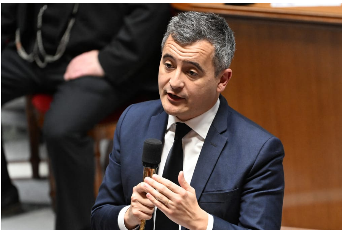
Opoziční strany již požadují rezignaci ministra vnitra Géralda Darmanina a nové volby

Porážka vlády v pondělí byla zvláštním šokem, protože imigrační zákon pečlivě připravovala měsíce. Po loňské parlamentní porážce byl několikrát odložen a pokaždé zvýšil sázky pro Macronovu vládu.