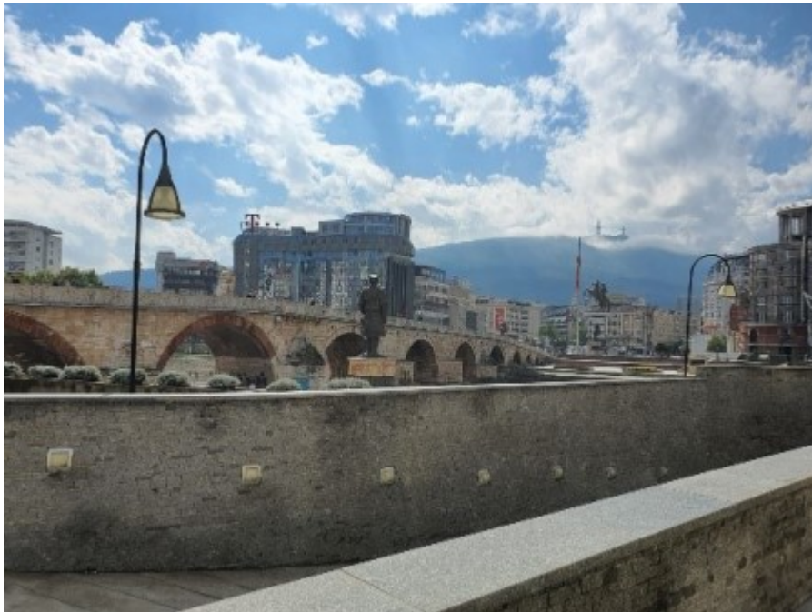
Kamenný most ve Skopje

přes vysoké hory. Tam jsou hlavně ovce a typické – pro rozvojové země – rozestavěné nebo nedokončené stavby. Tím je Balkán – z toho mála, co jsem za dlouhá léta viděl – typický.