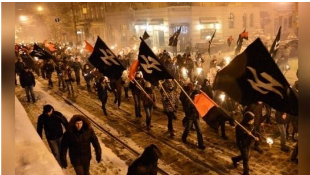
Neonacisté pochodují ulicemi Kyjeva pod symboly Vlčích háků