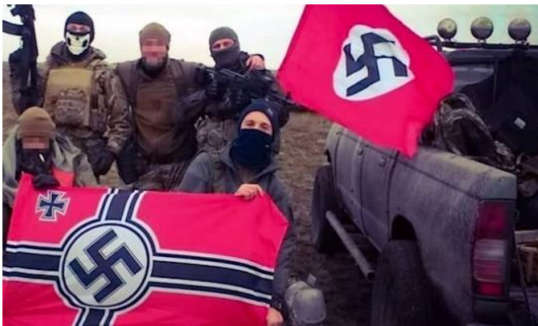
Společně s jednotkou Kraken Oděsu ubráníme!