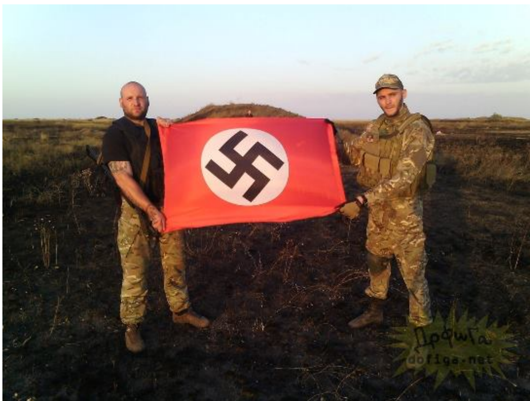
Svastika nesmí u Ukrajinců chybět ani v první linii pod Chersonem