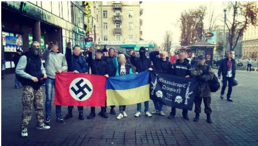
V ulicích Charkova - symboly nejvzácnější - svastika, ukrajinská vlajka a papor jednotek SS