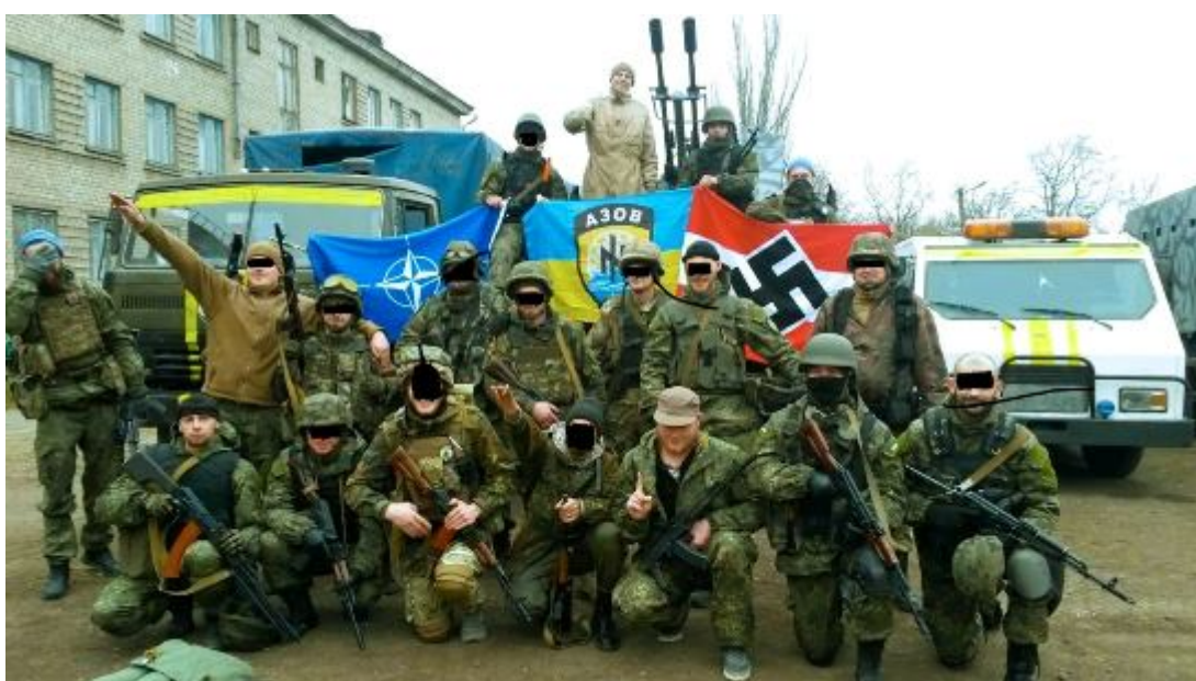
Kromě praporů pluku Azov a nezbytné svastiky nechybí v první linii ani vlajky NATO