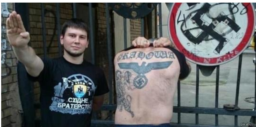
Členová Azova a jejich úcta k symbolům Třetí říše