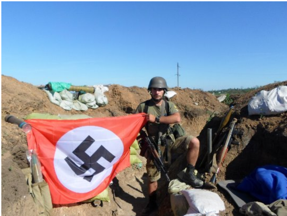
Se svými vzory v zákopech u Slavjansku