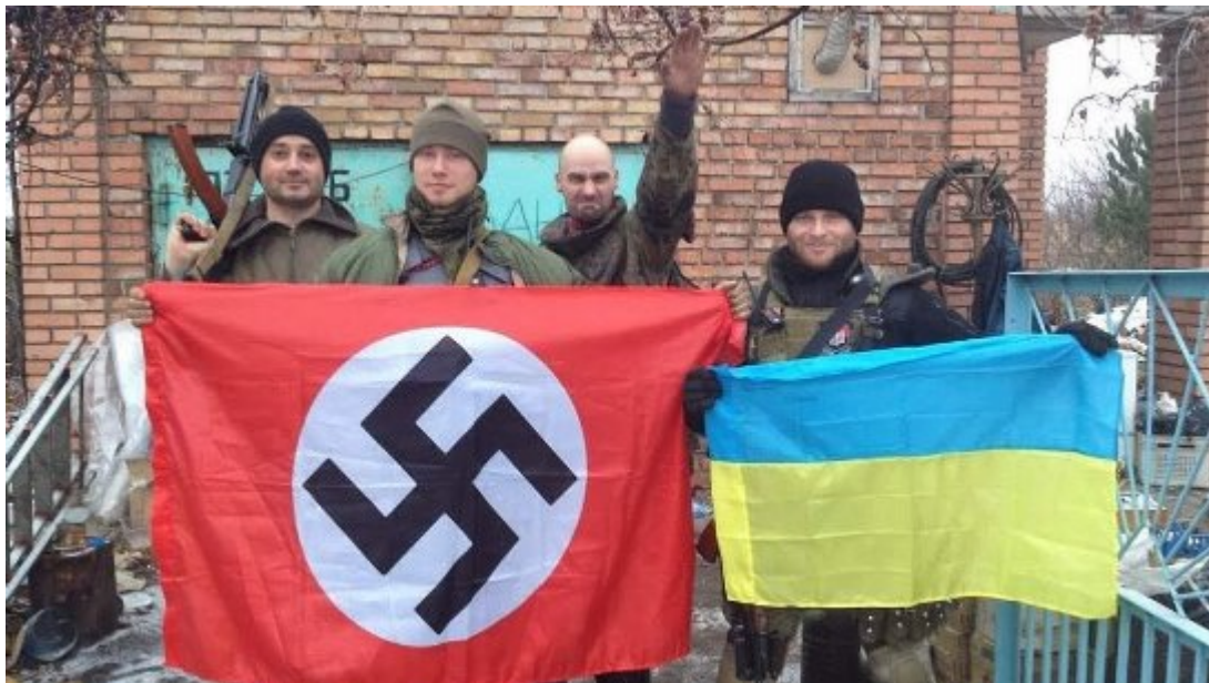
Sláva Ukrajině v obsazeném Izjumu