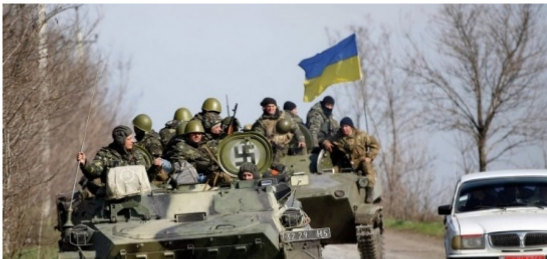
Vzhůru na frontu na Donbas pod hákovým křížem