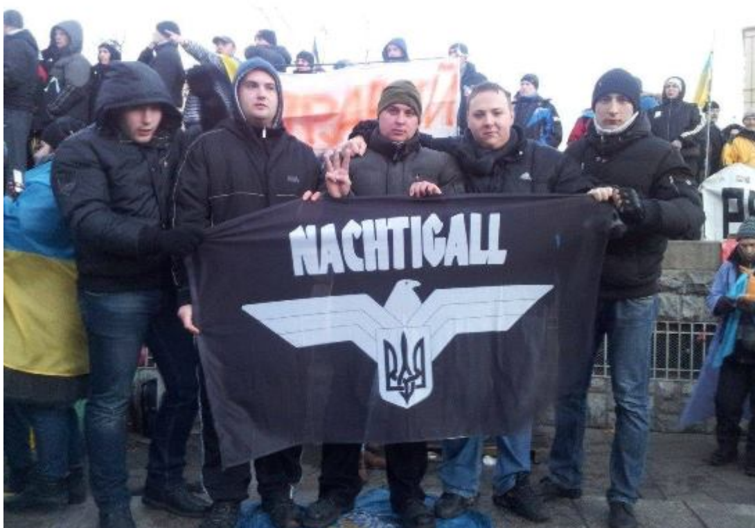
Symbolika nacistické jednotky Nachtigal ruku v ruce s ukrajinským trojzubcem