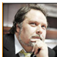
Autor: Petr Bahník Pedagog, publicista Více o autorovi ZDE