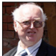
Autor: Radomír Malý Historik, publicista Více o autorovi ZDE

Ještě přesnější bude, když přirovnáme tuto taktiku Božích odpůrců k postupu jezinek ze známé pohádky Boženy Němcové o Smolíčkovi pacholíčkovi. V obou případech stojí na začátku úmyslná lež, že respektují daný řád a pravidla, chtějí pouze nepatrnou výjimku jako „nutné zlo“. Když toho dosáhnou, tak agresivně postupují dál a z „nutného zla“ se náhle stane obecné dobro a z dobra zlo. Tím se odhalí sami jako podvodníci a lháři, ale už je pozdě.