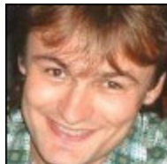
Autor: Luboš Motl Matematik a fyzik Více o autorovi ZDE

Někteří lidé tvrdí, že prosazení uhlíkové nuly by bylo naprosto snadné a levné, pod 2 biliony dolarů (celkové integrované výdaje) – pokud bychom postavili spoustu jaderných elektráren. Taková tvrzení jsou naprosto šílená.