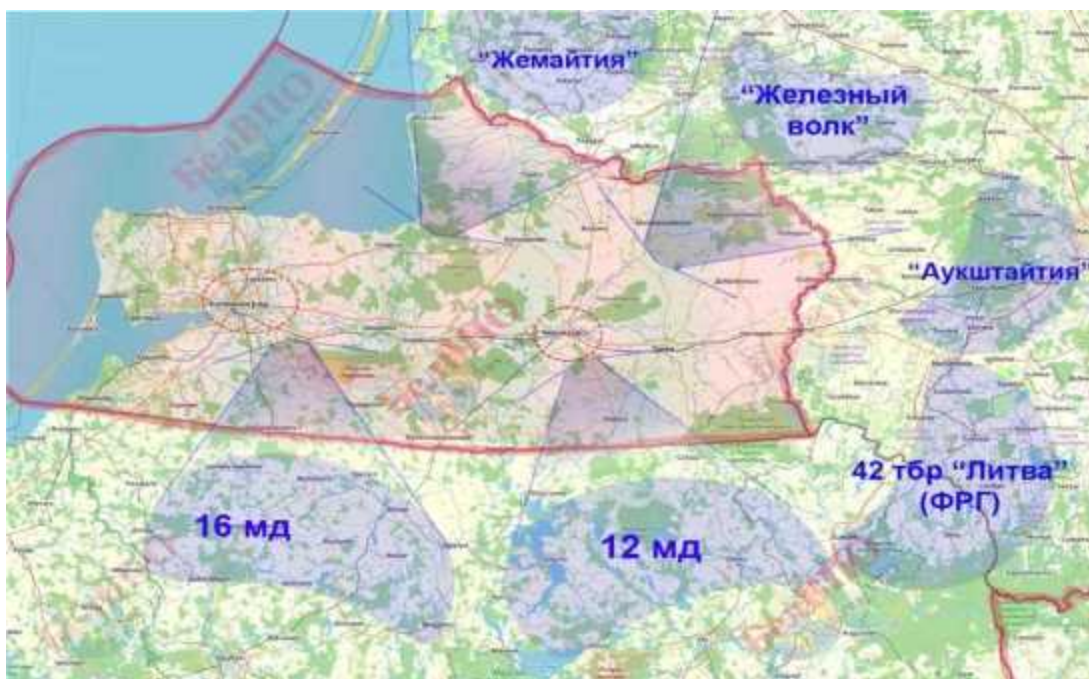
Mapa s obklíčením enkávy Kaliningrad

Situaci dále vážně zhoršují prohlášení z Kodaně o brzkém uzavření vodních cest pro ruské lodě, stejně jako budování amerických sil i nadcházející cvičení NATO v této oblasti. Je proto důležité bedlivě sledovat, co se děje kolem Kaliningradské oblasti. Nasazeny již byly námořní síly NATO, americké jednotky čítající asi 20 tisíc vojáků, 30 tisíc polských vojáků a 10 tisíc Litevců. Do koridoru Suwalki se přesune také 42. tanková brigáda „Litva“ s 5 tisíci vojáky. Celkový počet armád NATO tak dosáhne asi 70 tisíc vojáků, připravených obsadit Kaliningrad a jeho okolí.