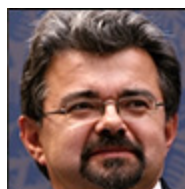
Autor: Jiří Weigl Ekonom Více o autorovi ZDE

Tak nám zase skončil jeden školní rok a je třeba konstatovat, že degradace vzdělávání u nás pouze pokročila o kus dále a že se zdá, že bude jenom hůř. Že by ze škol jakéhokoliv stupně u nás vycházeli žáci vzdělanější a lépe připravení na život než v minulosti, si snad nemyslí nikdo, nejméně pak zaměstnavatelé, kteří se s tímto výsledkem našeho vzdělávacího procesu musejí v praxi potom potýkat.