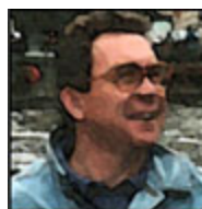
Autor: Václav Danda Publicista Více o autorovi ZDE

Útok ukrajinských ozbrojenců na Kurskou oblast může mít pro Kyjev mnohem horší následky, než si jeho zosnovatelé (včetně britských, kteří se na přípravě podle všeho podíleli) umějí představit. Aniž dosáhli jiných než mediálních cílů, tento sebevražedný výpad ovlivní postavení ukrajinských jednotek na jiných částech fronty a dlouhodobě naruší systém kontroly vojsk. Kurské dobrodružství nebude mít žádný „pozitivní vliv na vyjednávací pozici Kyjeva“, tvrdí současně analytici.