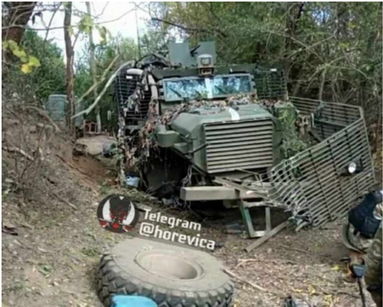
Britský obrněný vůz "Mastiff" před a po příjezdu na frontu.