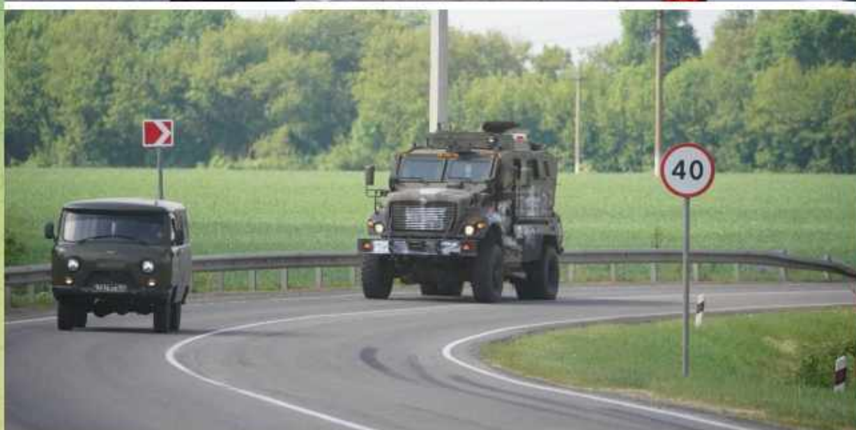
Трофейный International M1224 MaxxPro в Белгородской области.

Zbývá jen připomenout, že na tomto světě neexistují žádné zázraky. A každé dobrodružství, zvláště na bitevním poli, jde vždy stranou k těm, kdo ho organizovali. Když takzvaná „politická účelnost“ začne vládnout show ve vojenských záležitostech, ukáže se přesně to, co se dnes děje na Ukrajině. Kde vidíme, jak dlouho slibovaná ukrajinská ofenzíva hoří jasným plamenem, A to v pravém slova smyslu.