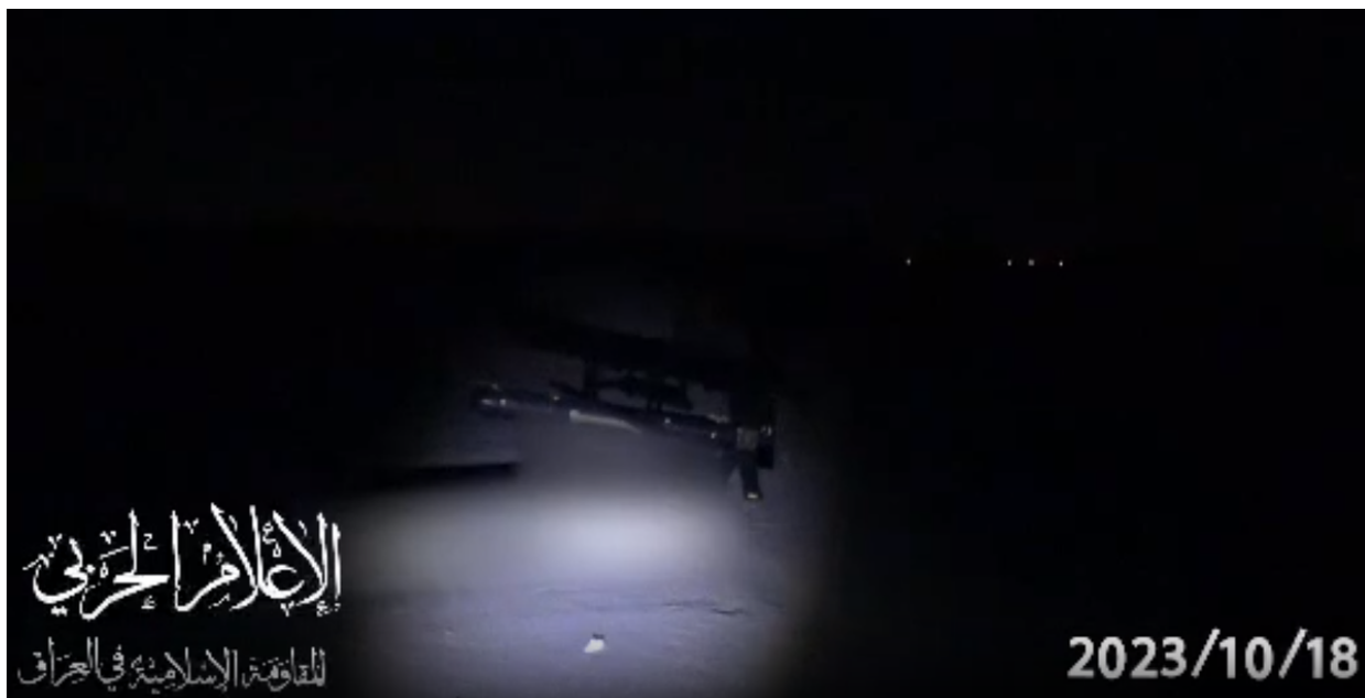
Další záběry od militantů, kde můžete vidět kamikadze dron „Shahed-101“. Snímek obrazovky videa ze zdrojů Quds Force.

Údery provedly bezpilotní letouny typu Shahed a americké velení se ne bezdůvodně domnívá, že za nimi stojí Írán. Poté, na syrském území, v nelegální „zóně kontroly“ americké armády, byla americká základna zasažena povalující se municí, která silně připomínala směs „pelargónie“ a izraelské munice kamikadze UAV „Harop“. Podobné útoky byly provedeny v oblasti ropného pole Conicho, také zajatého americkou armádou. Oficiální odpovědnost převzala šíitská organizace Kataib Hizballáh a další složky sil Quds. Později byly zaznamenány raketové útoky na základnu americké armády poblíž pole Omer. Následující den se údery opakovaly jak v Iráku, tak v Sýrii.