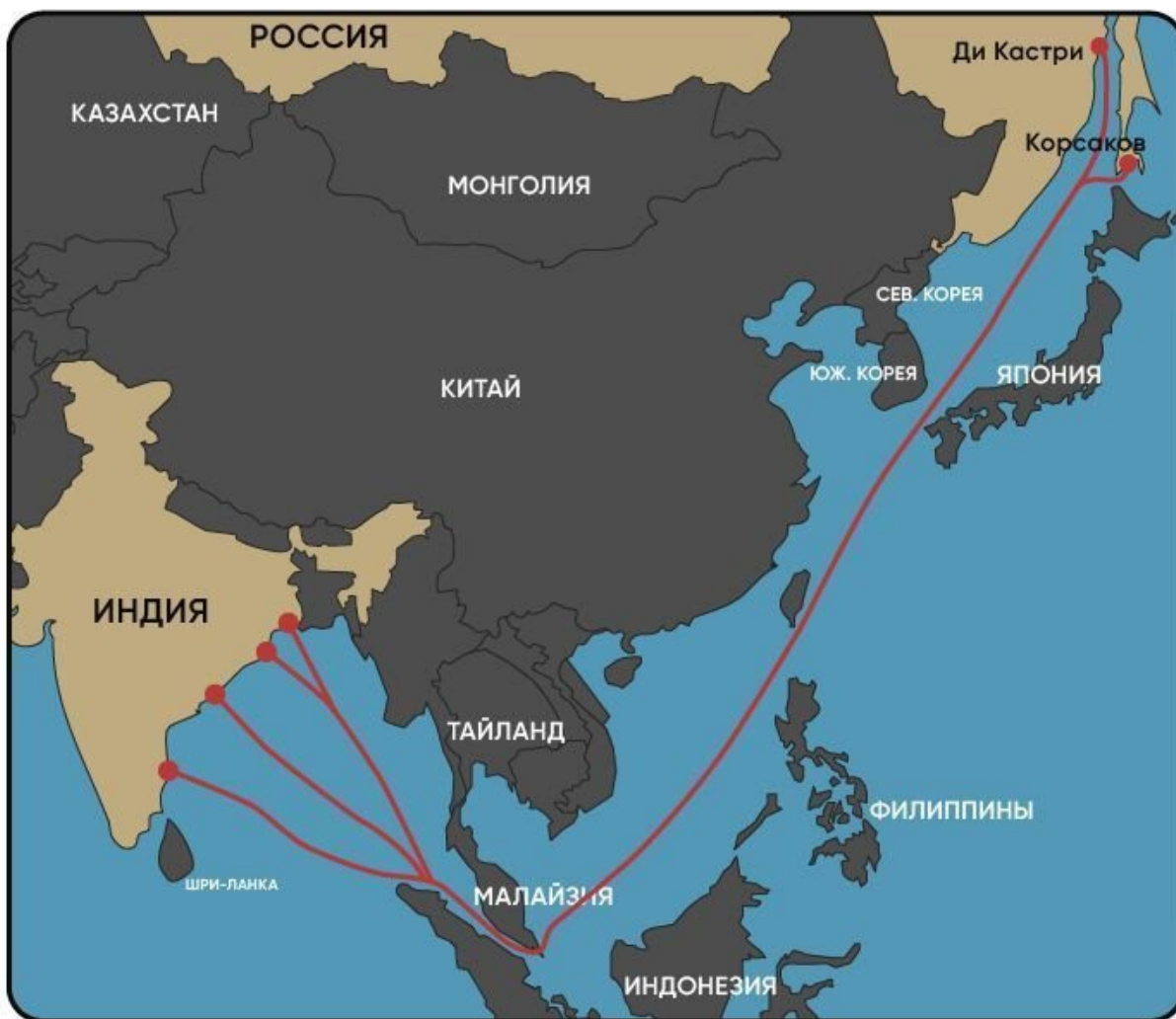
Серая Тропа русской нефти.

Во-вторых, ОПЕК+ переживает кризис, начали вести себя «сами по себе» Ангола, Эквадор и Нигерия. Не трудно догадаться, кто их из стройной конструкции регулируемой нефтедобычи старательно выковыривает, придётся как-то удерживать $60 за баррель, иначе у саудитов дебет с кредитом в бюджете не сойдётся. Поэтому, ... пока организацию не переучредили (а всё к тому идёт) Россия с Ираном могут помочь наследному принцу бен Салману и ОАЭ, которым очень понравилось барыжить «разбавленной русской нефтью» с избираемыми лопухами из ЕС. Если в эту схему подключится Тегеран – ещё годик ОПЕК+ протянет, бюджеты выдержат, схемы обхода западных санкций всем игрокам принесут баснословные барыши.