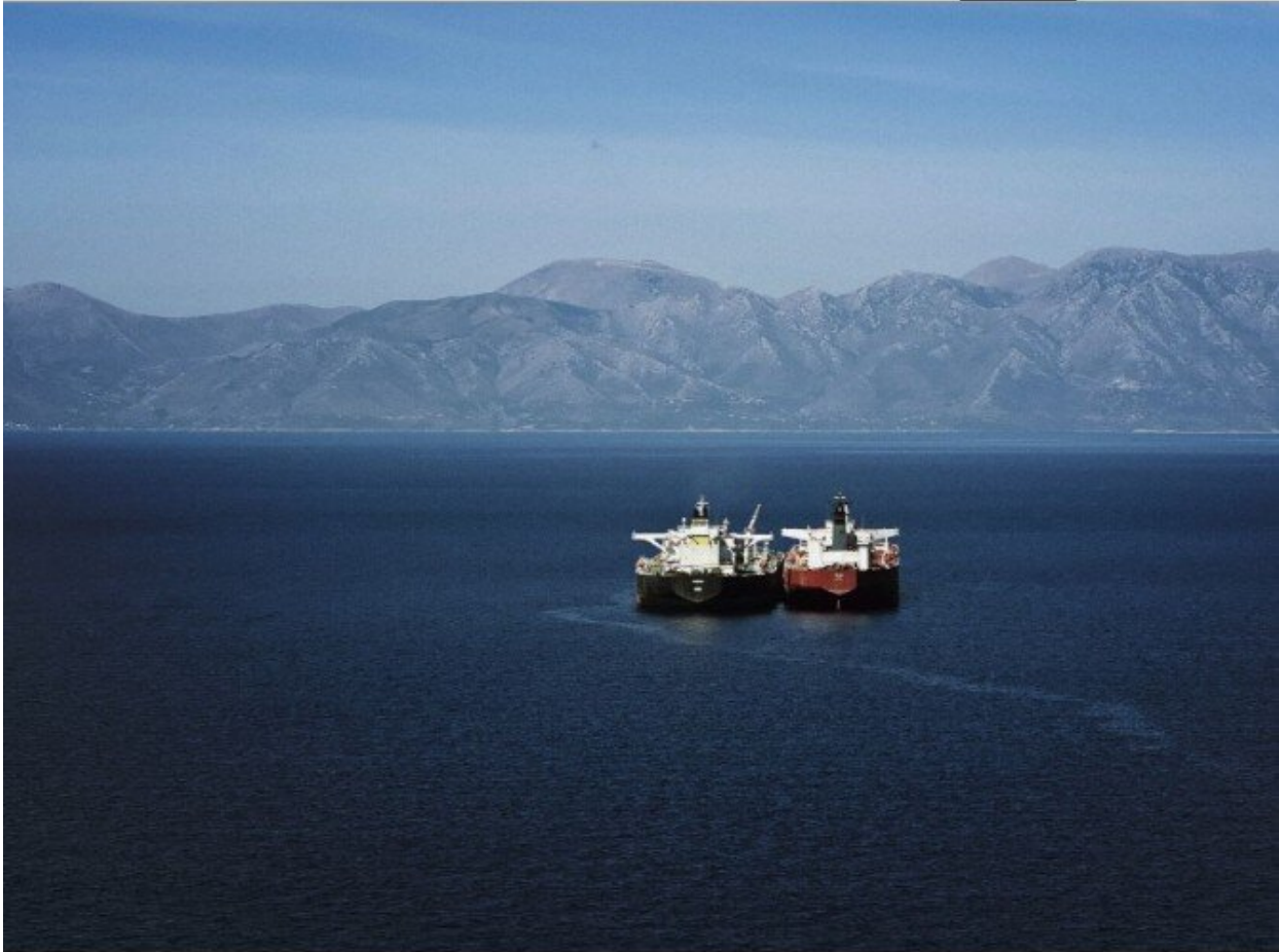
The Simba, left, and the Turba oil tankers in the Laconian Gulf, Greece, on Sept. 19.