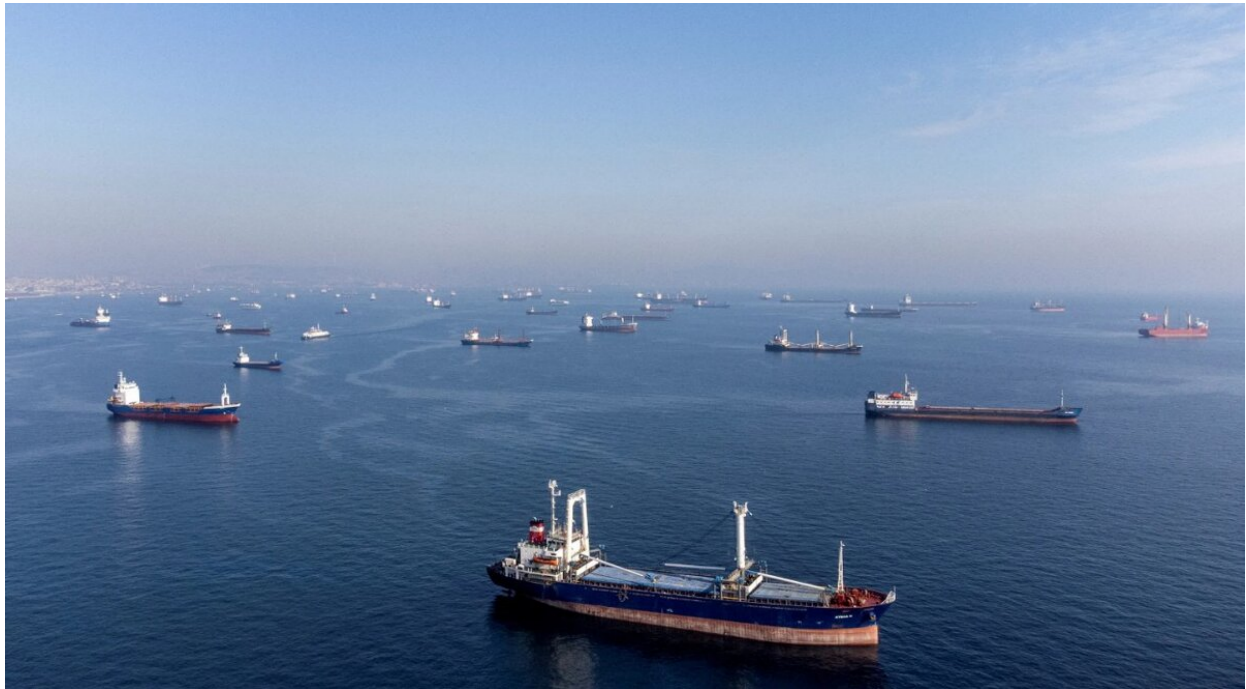
Tankery stínové flotily.

V důsledku takových akcí západní společnosti ztratily miliardy a nadále je ztrácejí, přičemž dodržují cenový strop, který byl původně zaveden proti Rusku.