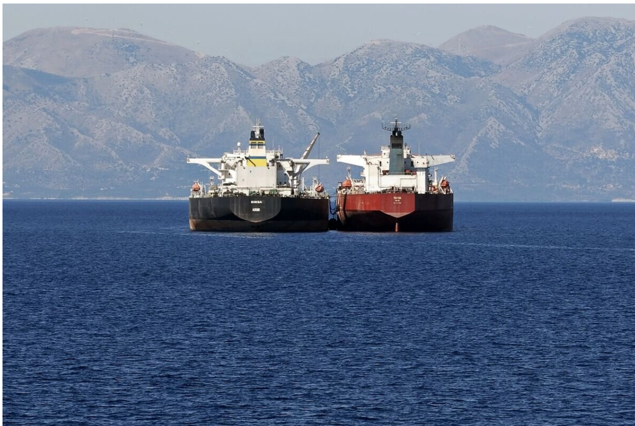
Selhání západních sankcí na ruský vývoz ropy lze vidět v mezinárodních vodách u pobřeží Řecka.

I jejich pohyby jsou podezřelé. Digitální sledovací systémy ukázaly, že 26letá Turba pluje více než čtyři míle daleko, když 900stopá Simba převážela palivo do menšího plavidla za plného dohledu dokumentárního štábu Bloombergu. Ve stejný den, kdy v září došlo k tomuto přesunu z lodi na loď, více než tucet podobných plavidel – součást obrovské stínové flotily – plulo poblíž a dělalo nebo se chystalo udělat totéž.