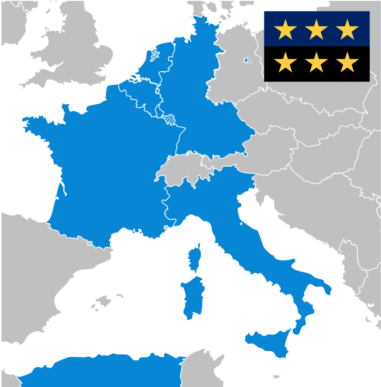
Mapa ESUO při jeho založení v roce 1952.

Moderní Evropská unie vznikla na základě Evropského společenství uhlí a oceli (ESUO).