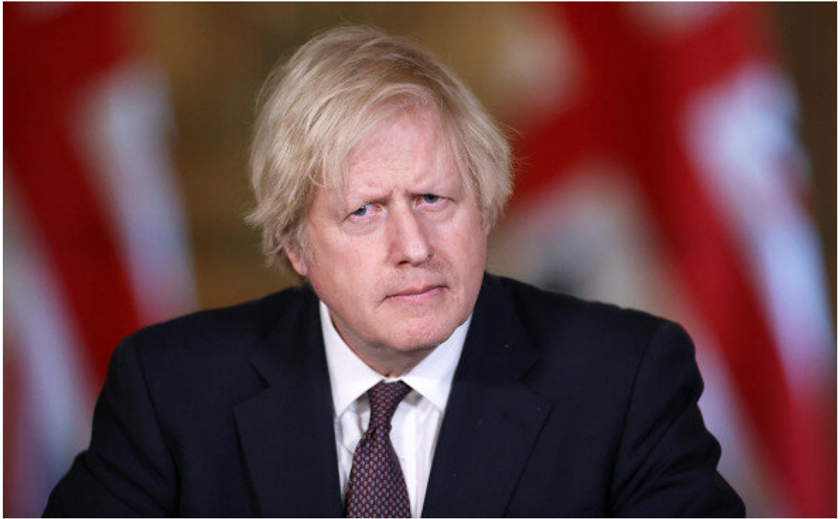
Boris Johnson