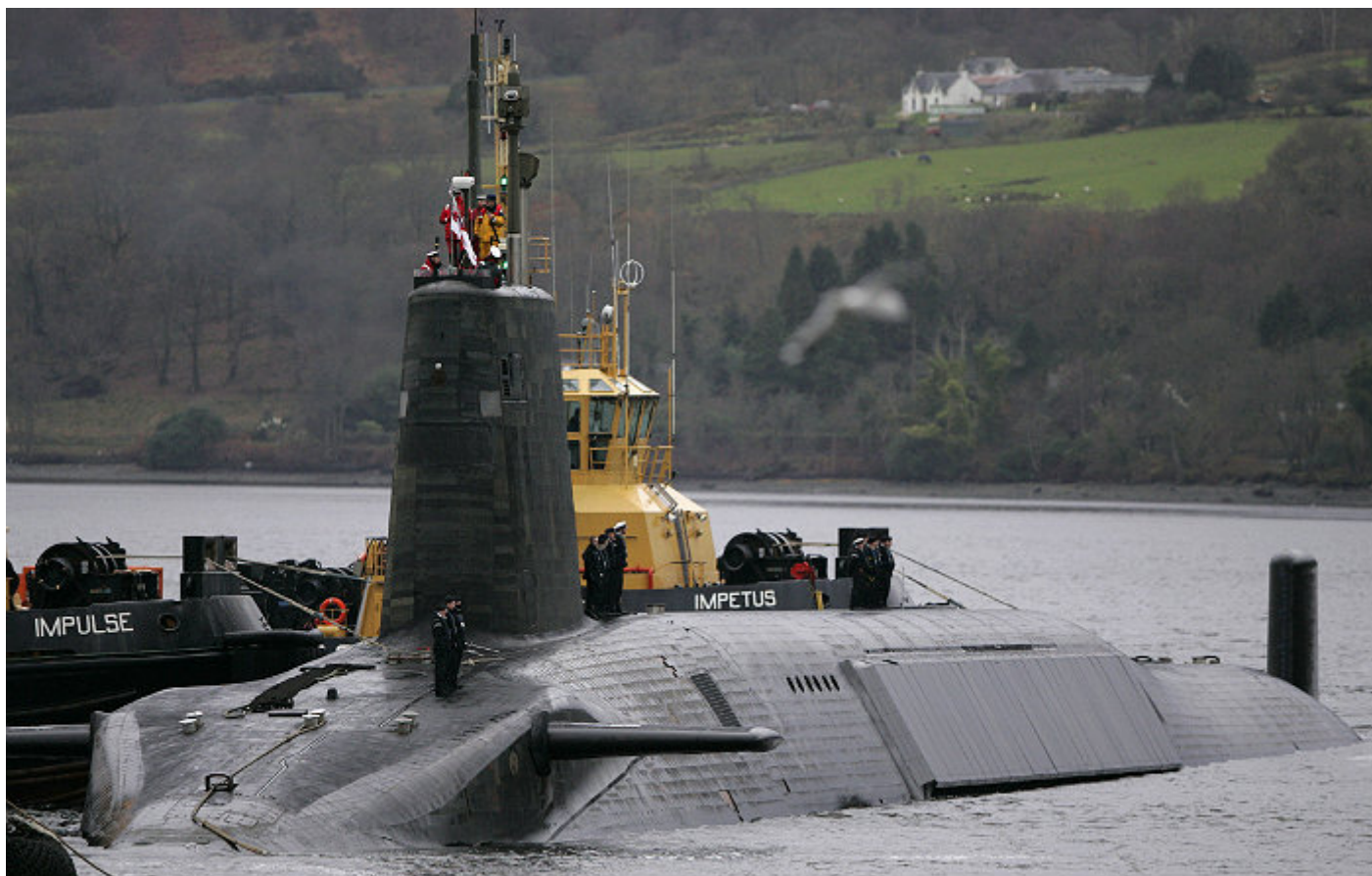
Britská ponorka Vengeance.

Krásný a hrozivý start se ale změnil v hlasitý prd, protože jedinou britskou součástí této střely je jaderná hlavice, která tam naštěstí nebyla, zatímco samotná nosná raketa je americkým vývojem, přijatým americkým námořnictvem v roce 1990.