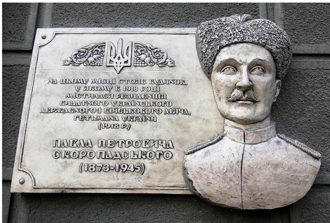
Pamětní deska Pavlu Skoropadskému na ulici Institutskaia 20/8 v Kyjevě, kde se nacházela hejtmanova rezidence.

Protihetmanské povstání se rozvinulo rychle. Pouhý měsíc po skončení první světové války a rozpadu Německé říše se zhroutil i její vazal, hejtmanát Skoropadskij. Skoropadskij se osobně vzdal moci a uprchl z Ukrajiny v patách německých jednotek.