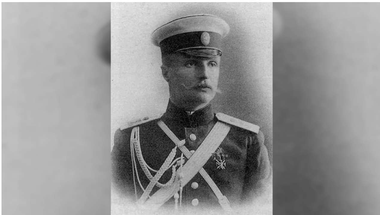
Pavel Skoropadsky (1906)