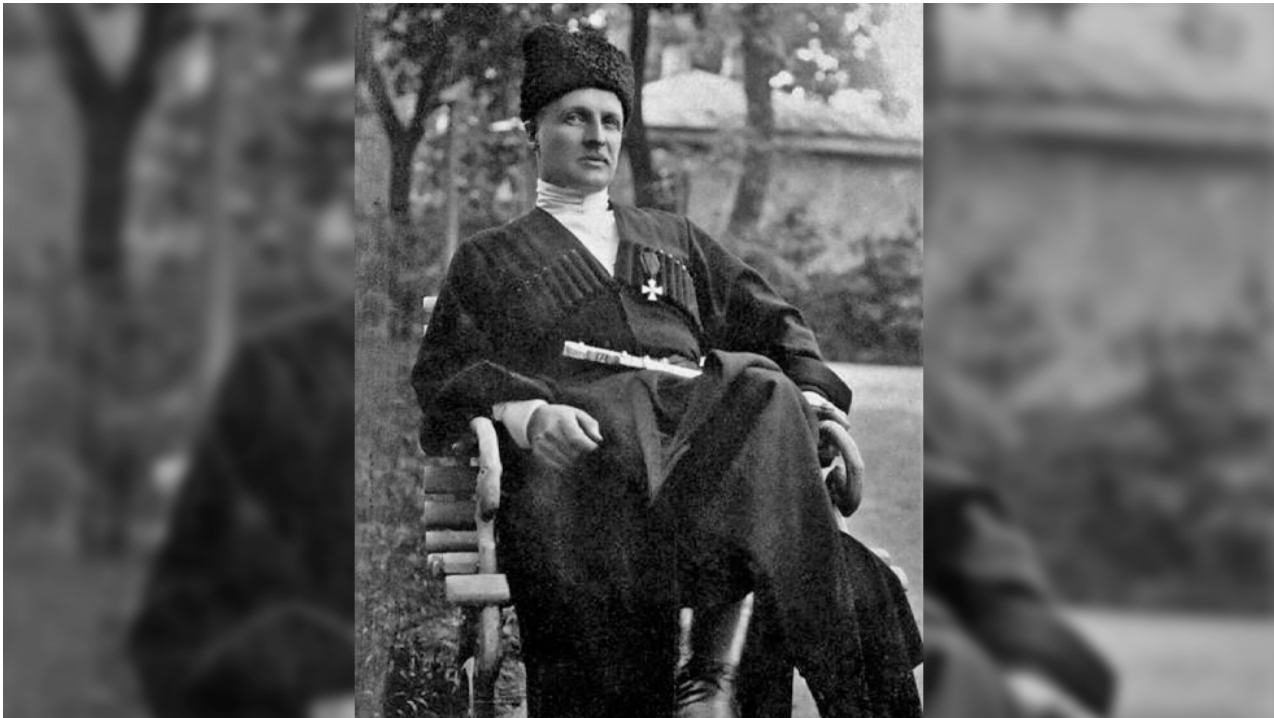
Pavel Skoropadsky